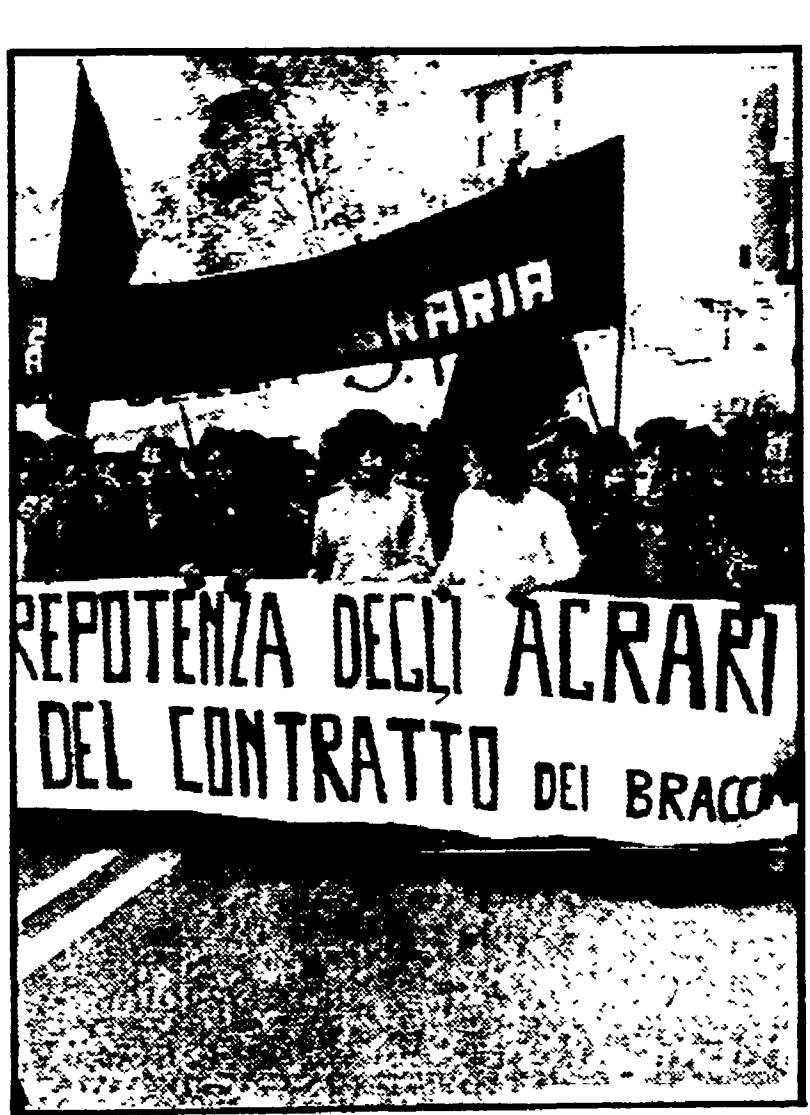
REPOTENZA DEGLI AGRARI DEL CONTRATTO DEI BRACCANTI

Si è concluso il secondo congresso regionale della Federbraccianti CGIL