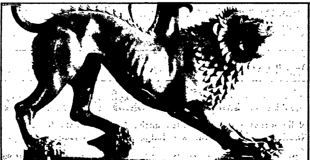
Chimera di bronzo etrusco restaurata dal Cellini

Palazzo Pitti: « Antichi strumenti musicali italiani » (fino a dicembre); Palazzo Medici Riccardi (Via Martelli): « I teti russi: 5 anni di immagini all'interno » (fino al 31 marzo); « Firenze e la Toscana dei Medici nell'Europa del Cinquecento: Palazzo Strozzi: « Il primato del disegno »; Palazzo Vecchio: « Committenza e collezionismo mediceo »; Palazzo Medici Riccardi: « La scena del Principe »; Orsanmichele: « I medici e l'Europa 1532-1609 »; « Editoria e società »; Biblioteca Laurenziana: « La rinascita del