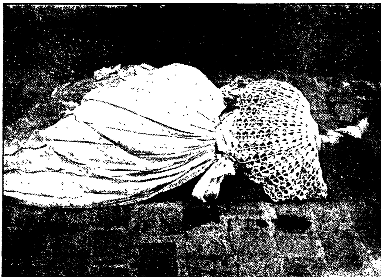
Un'immagine da: « The song of the shirt »

Comunque la donna è donna anche per Godard e compagni e chi volesse cogliere la sensibilità maschile sull'altro sesso, sempre più attuale, la rassegna dedicata da Spaziozero alla nouvelle vague, secondo tempo, con preziosi recuperi come Zazie nel metro, tratto da Malte dal libro di Quenau o Una storia americana di Godard o, perché no, L'anno scorso a Marienbad.