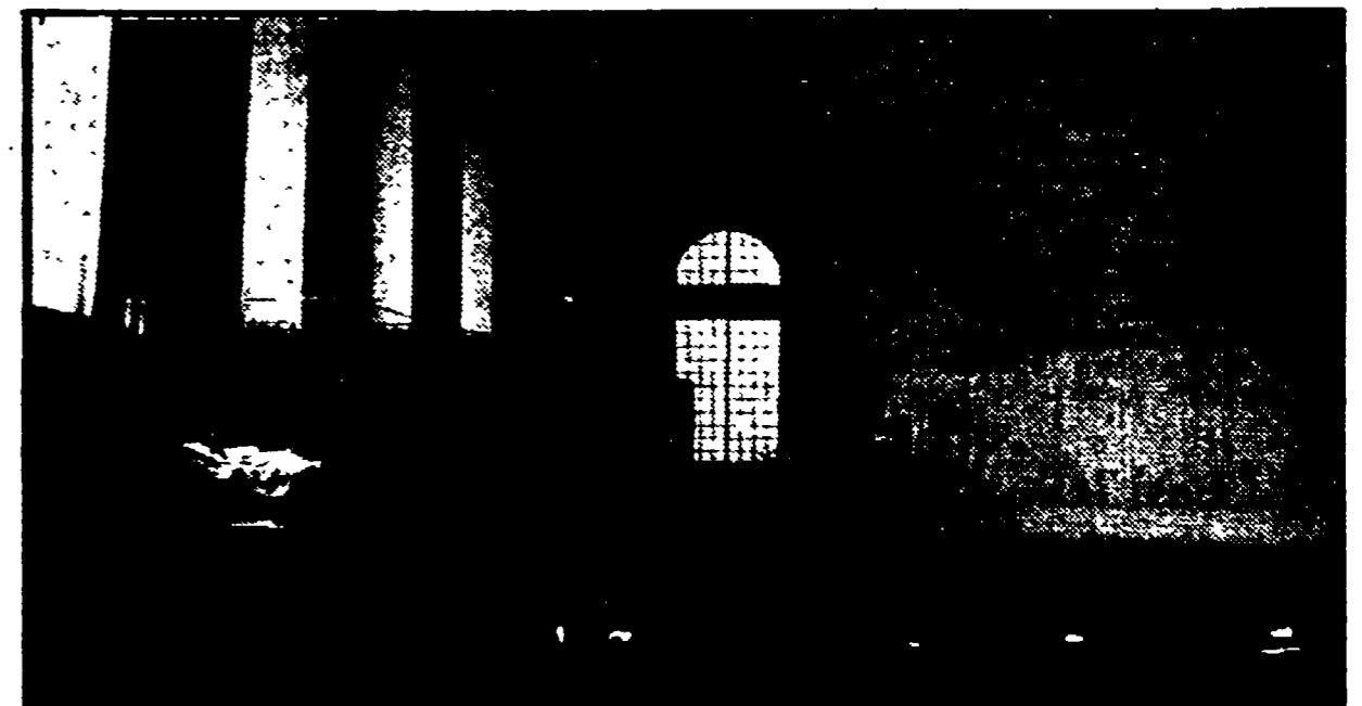
Un allestimento della « Traviata »