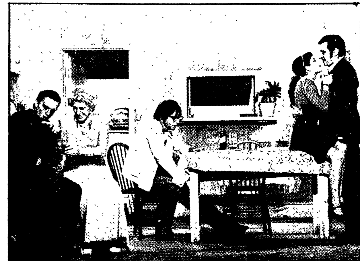
Il compleanno di Pinter per la regia di Carlo Cecchi

Massimo Castrì è certamente uno fra i più interessanti registi delle ultime generazioni. Da anni, con risultati alterni ma con indubbio rigore, sta scandagliando tra le pieghe della grande drammaturgia borghese con intento prima critico, ci pare, che spettacolare. Regista freddo, di sicuro smalto intellettuale, Castrì prosegue ora il suo viaggio verso i climi freddi del nord dell'Europa e propone (dopo alterne vicende) un Ibsen, Rosmersholm, al Rondò di Bacco a partire da stasera fino a domenica.