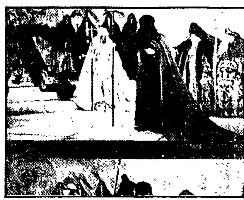
Nella foto sopra: Eisenstein - La disputa tra Ivan e il metropolita Filippo dal film «La congiura dei bojar»; nella foto a destra: studio di Inquadratura e di messa in scena della sequenza dell'assassinio della madre di Ivan.

saputo approfittare del pass-falsi di Catania e del Campobasso non riuscendo così ad entrare di autorità perentoriamente nel discorso promozionale. In C/2 questo discorso è ormai ben delineato con Rondinella e Prato che fanno da prime attrici. C'è solo la preoccupazione di tenere a debita distanza le inseguitrici. Gioacando con la derivante tranquillità le partite restanti sono solo una prassi da rispettare. Oggi intanto gli uomini di Melani incontreranno la Cerretese mentre i lanieri ospiteranno il Fivoli. Le restanti partite vedono il Pietrasanta ospitare il Dhertona. Il Montecatini che va a trovare il Savona, mentre la Sangonesi va sul campo del Città di Castello e il Siena su quello dell'Albese. Restando due «derby» dei quali uno importante per la classifica e l'altro per il gioco che può far vedere. Grosseto Sansepolcro può determinare qualcosa nel bassifondo della classifica con gli uomini di Grassi alla disperata ricerca di risultati esterni per condurre in porto la salvezza. Mentre Carrarese-Lucchese è un discorso tra squadre deluse che sono partite con grandi programmi iniziali e che si ritrovano adesso a ridosso delle prime ma con un distacco tale da rinviare il discorso promozionale ormai al prossimo anno. Dovrebbe varare fuori una buona partita anche se ormai non lottano più per quegli intenti che si erano prefissi. Moreno Roggi