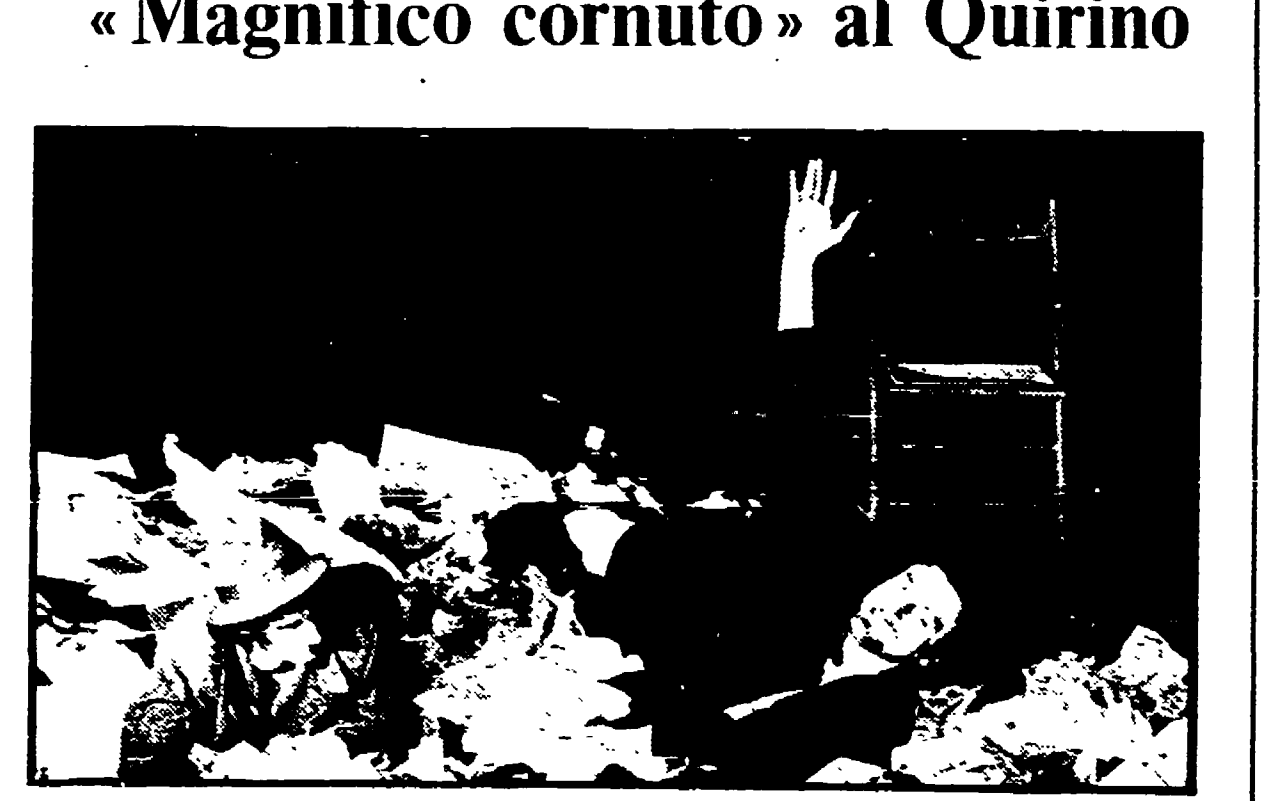
«La vera vita di... (varietà in sei scene) al Teatro Ateneo»

no Mazzone, a presentarlo per soli tre giorni. Al Misfit, ancora un autore francese: due interpreti di Jean Tardieu, interpretati da cinque giovani attori provenienti dall'Accademia d'arte drammatica: «Lo spartello» e «C'era jolla al castello».