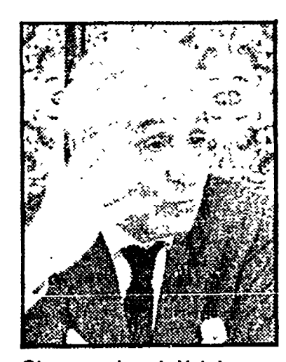
Giacomo Lauri Volpi

no e vent'anni fa, nel '60, pressoché di questi giorni, tenne qui all'Antoniano un bellissimo concerto, con il meglio del suo repertorio. Nella «Piccola Messa» di Rossini, risale ad 1803. Abbiamo un capolavoro, tanto più sorprendente, in quanto consapevolmente nato - e in tempi di grossi frastruoni sinfonici - per un