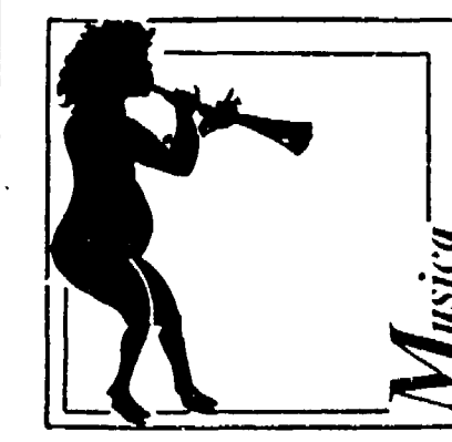
Giacomo Lauri Volpi

Ha ragione il sindaco Luigi Petroselli, quando respinge l'idea di un imbarbarimento della città - sveglia tradizioni di grande civiltà, anche musicale. Siamo capitati, domenica, alle 18, nell'«Antoniano» - viale Manzoni, dove l'Associazione «Vincenzo Bellini» teneva un concerto per ricordare Giacomo Lauri Volpi nel primo anniversario della morte, e la sala era piena.