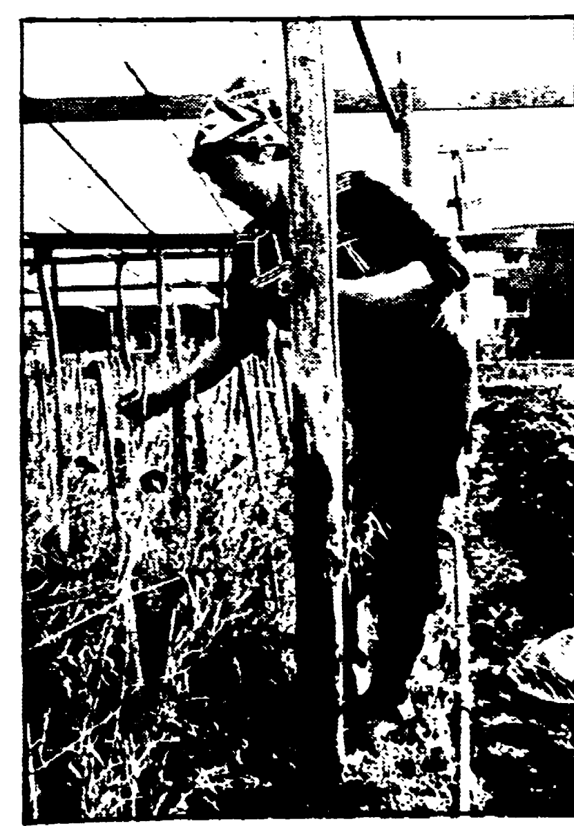
Una lavoratrice all'opera all'interno di una serra

urbanistico che faccia assumere a Sorano, Pitigliano e Sovana un significato territoriale nella Maremma meridionale.