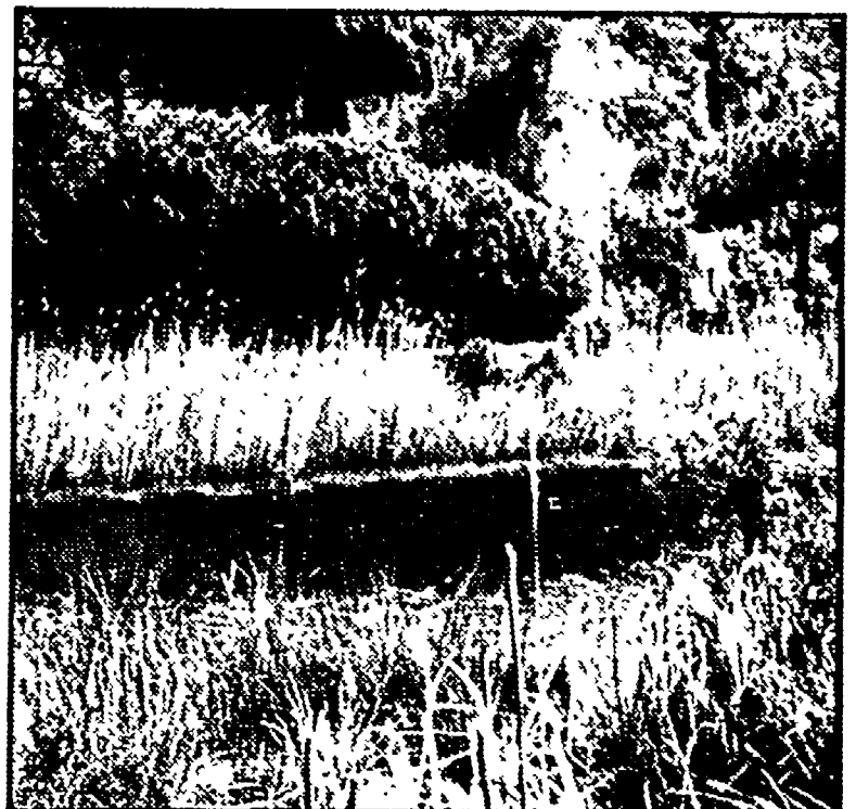
Uno scorcio del Parco dell'Uccellina nel Grossetano

Domani i primi servizi sulla realtà della provincia di Grosseto — Un bilancio ragionato