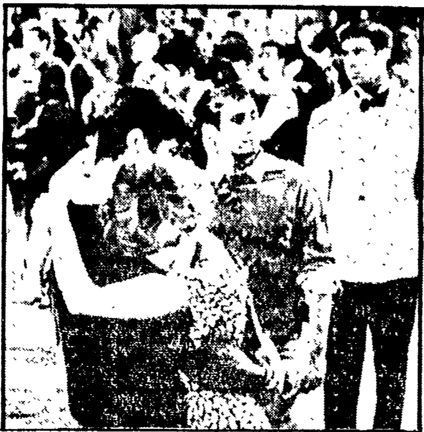
Una scena di « Non si uccidono così anche i cavalli? »