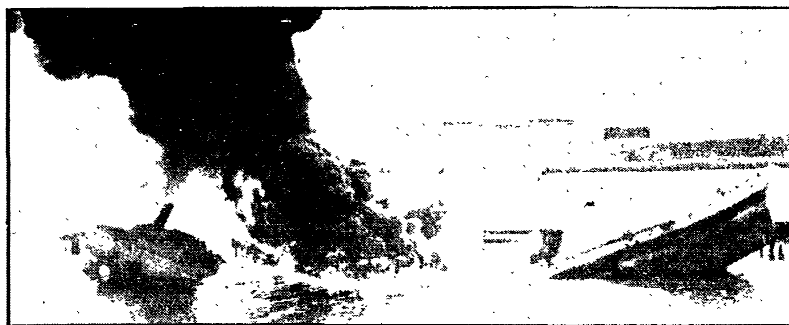
Ecco la drammatica immagine dell'affondamento di una delle tante «carrette» che solcano i mari

Una «industria del naufragio» - Chi incassa i premi delle assicurazioni - Un tragico bilancio di vite umane sacrificate - Carrette vecchie di 60-70 anni