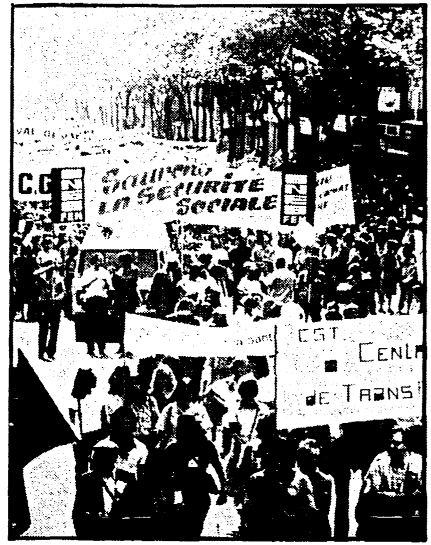
PARIGI - Un momento della manifestazione di ieri