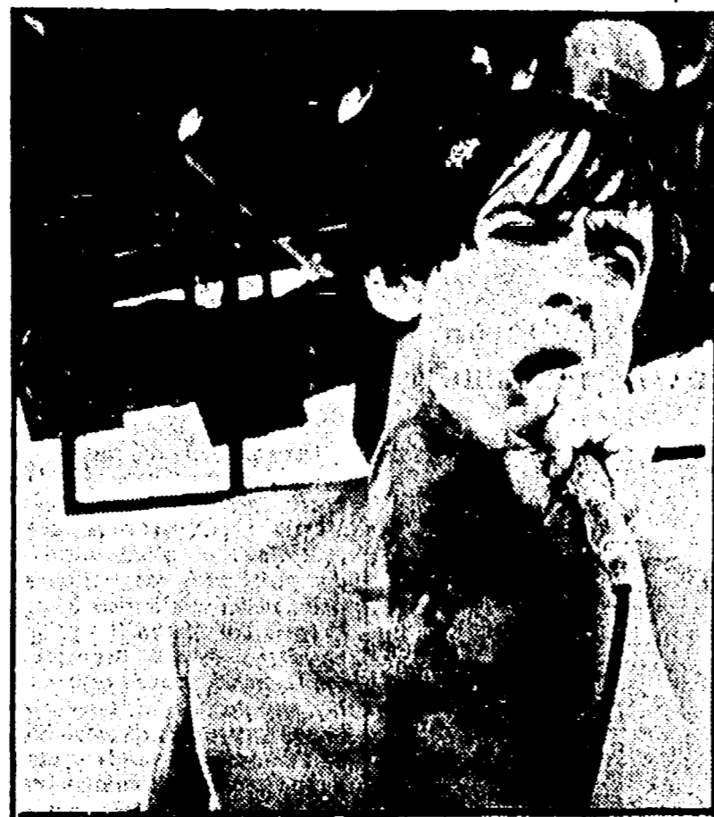
Il cantante rock Iggy Pop