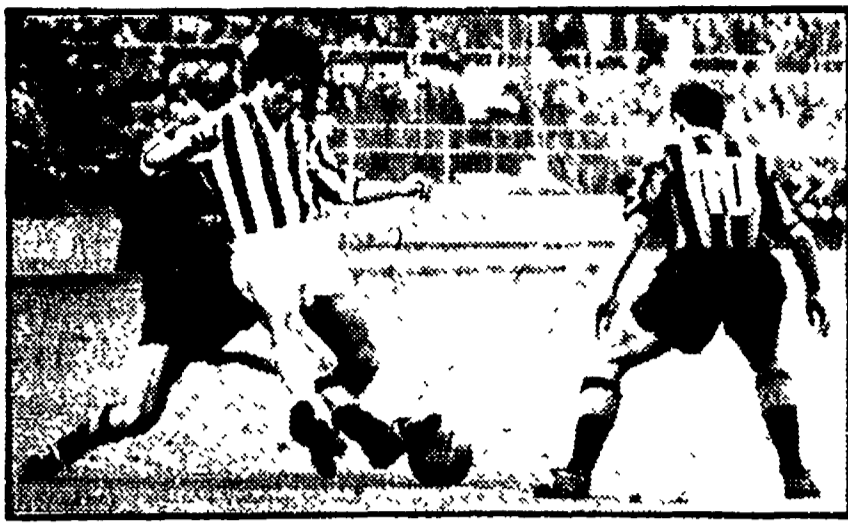
Un'azione di Omar Sivori ai vecchi tempi