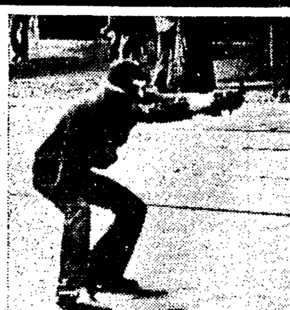
Aprile '77: In azione il partito armato