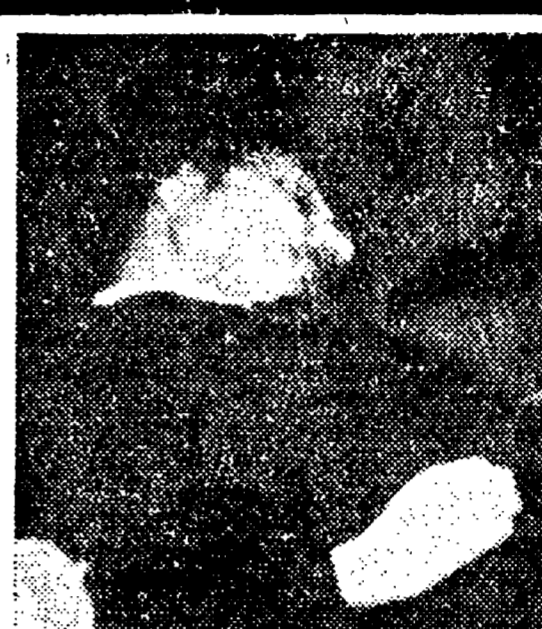
8 maggio '78: viene ucciso Aldo Moro