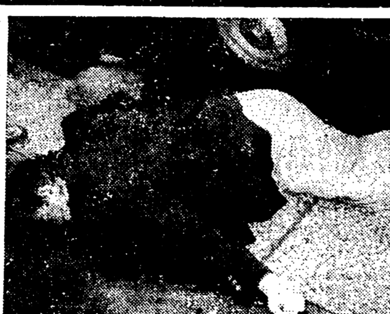
28 maggio '80: Il giornalista Tobagi ucciso dai terroristi