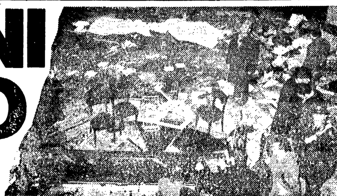
12 dicembre 1969: la strage fascista a piazza Fontana