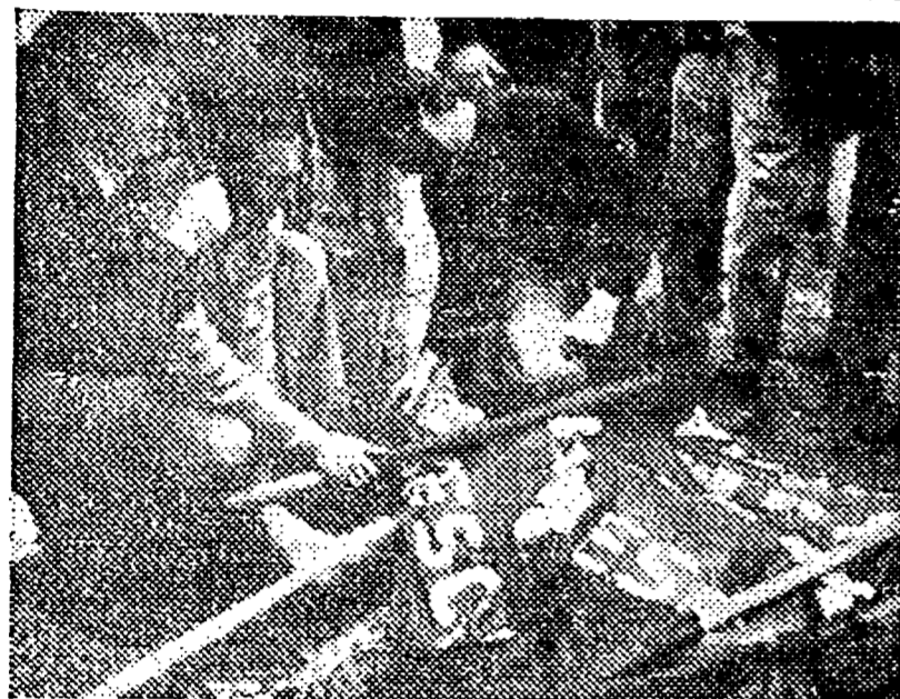
28 maggio '74: Brescia, piazza della Loggia