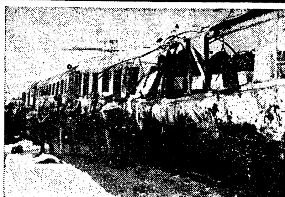
4 agosto '74: attentato al treno Italicus