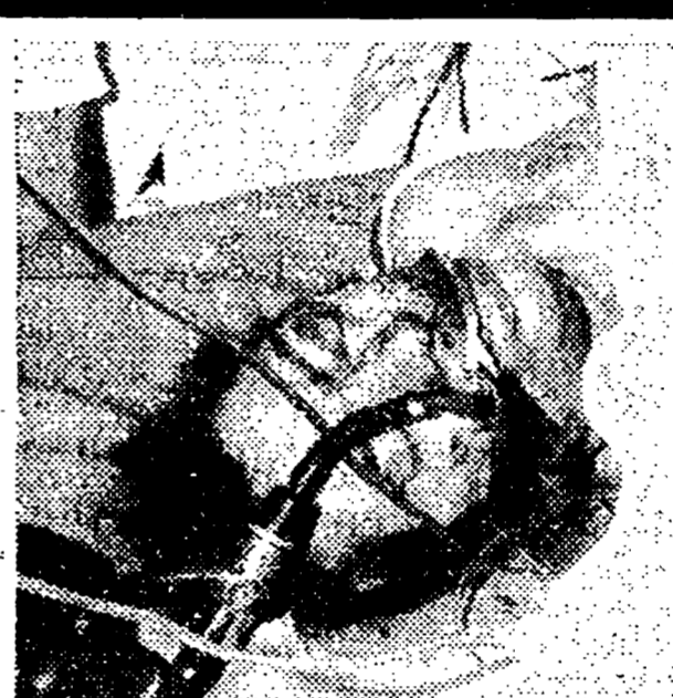
28 maggio '80: I fascisti sparano sui poliziotti