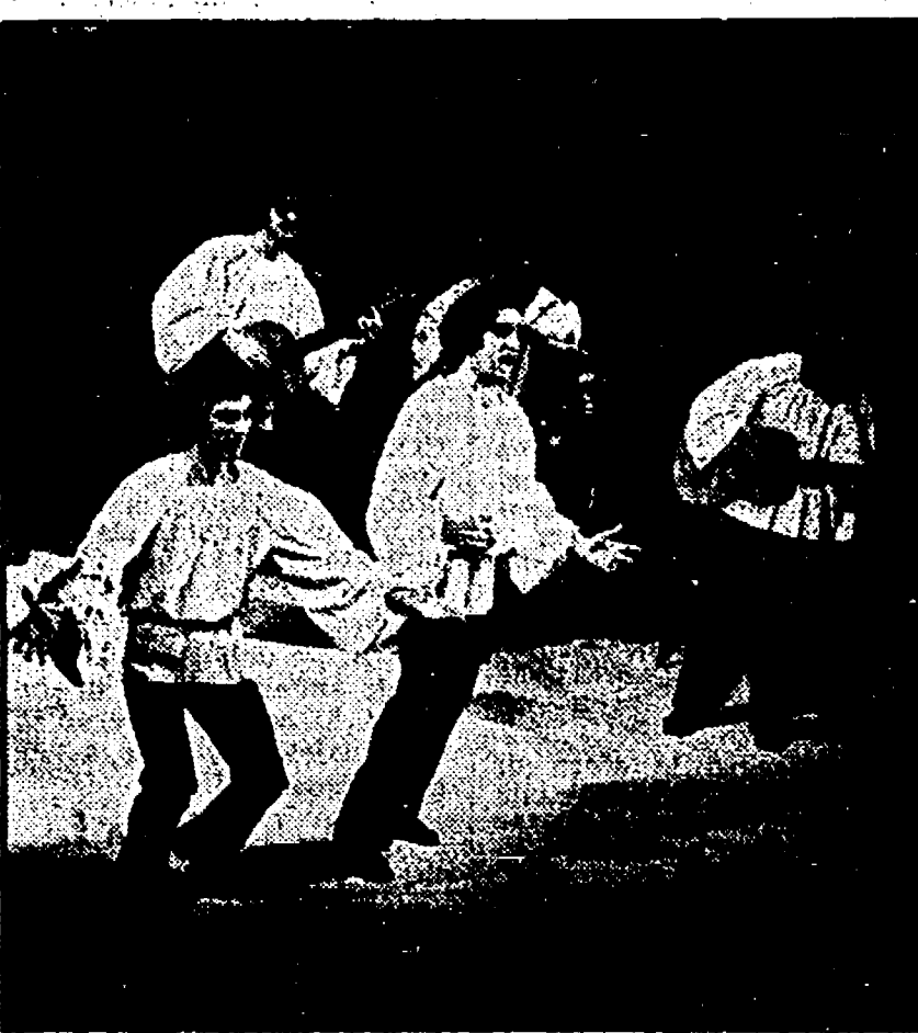
La Nuova Compagnia di Canto Popolare