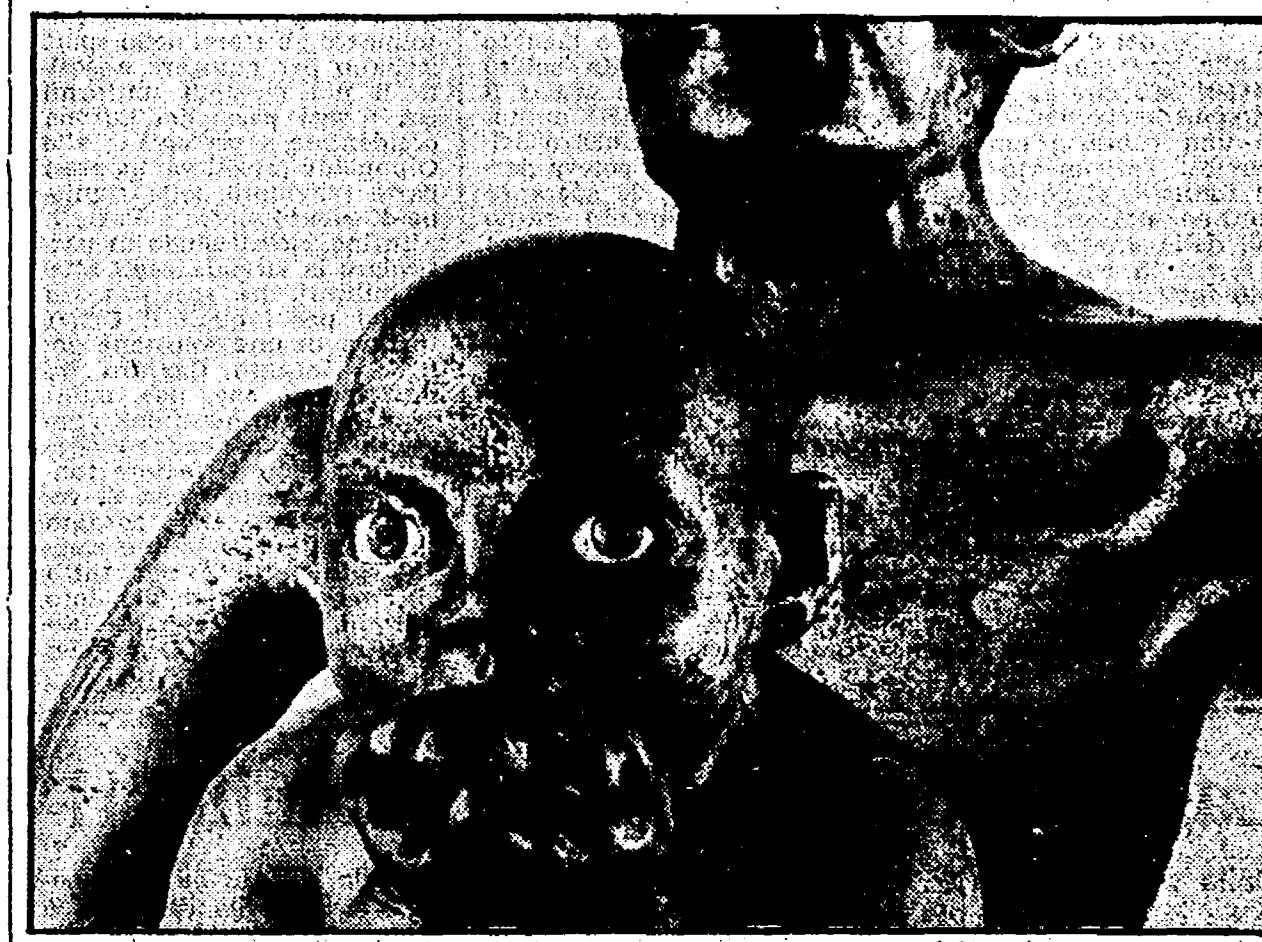
Un particolare di una scultura di Giuliano Vangi