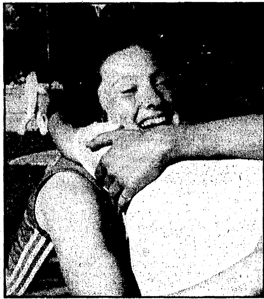
Gabriella Dorio felice dopo una vittoria.

Il 21° Meeting dell'Amicizia di Pisa, approdato felicemente a Pisa, ha avuto uno straordinario successo di pubblico. Le genti abituate ai saltatissimi prezzi del calcio, passando al botteghino per acquistare il biglietto esprimevano stupore e meraviglia.