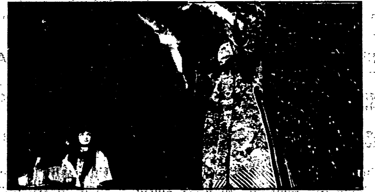
Un momento dello spettacolo dei maghi

Babà Ali cambiava il proprio «panciotto» in continuazione, senza che nessuno potesse intendere quale fosse il trucco nascosto.