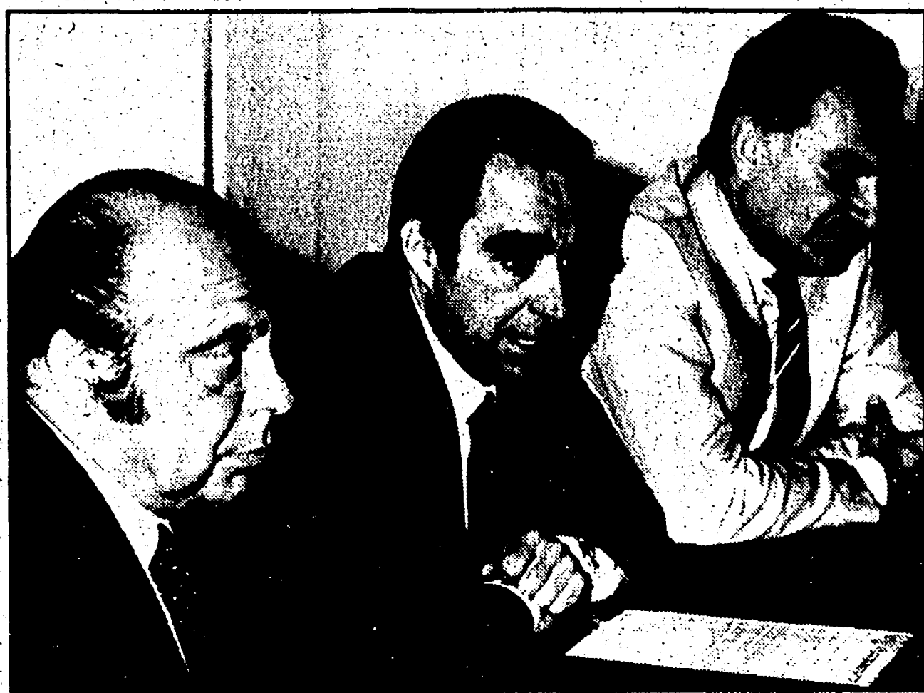
ROMA — Primo Nebiolo, Franco Carraro e Arrigo Gattai durante la conferenza stampa nella quale sono stati annunciati i nomi degli atleti italiani che parteciperanno alle Olimpiadi di Mosca.