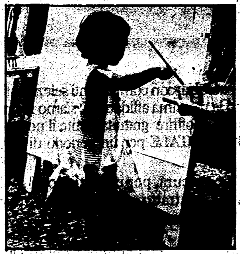
L'iniziativa della casa della cultura di Paglieta è riuscita a coinvolgere decine di bambini, ragazzi

« Ma non basta, e forse tante iniziative come questa - potrebbero chiudere tante falle che si aprono nella società e contrastare alcuni fenomeni negativi che riguardano in particolare i giovani. E' per questo che la presenza o meno di amministrazioni democratiche nei comuni può veramente essere determinante per decidere la qualità della vita della gente ».