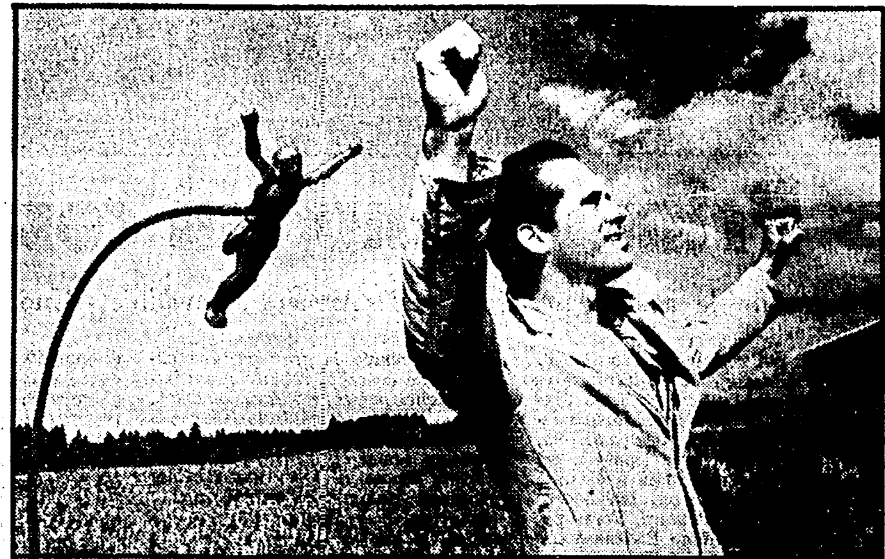
Qui sopra (e accanto al filolo) due inquadrature di « Nel corso del tempo »