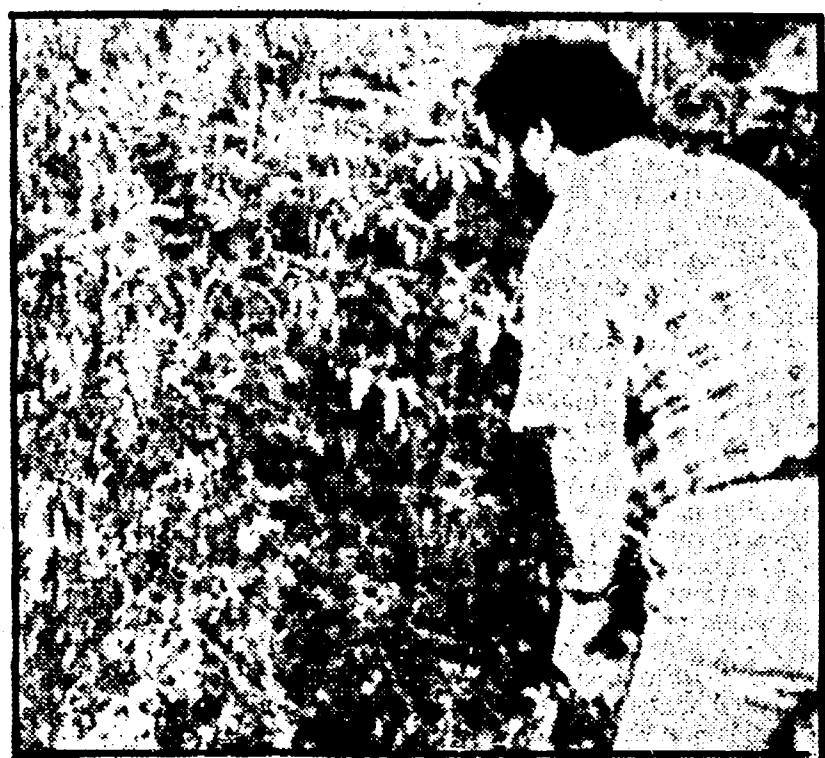
Il luogo dove è stato trovato il corpo