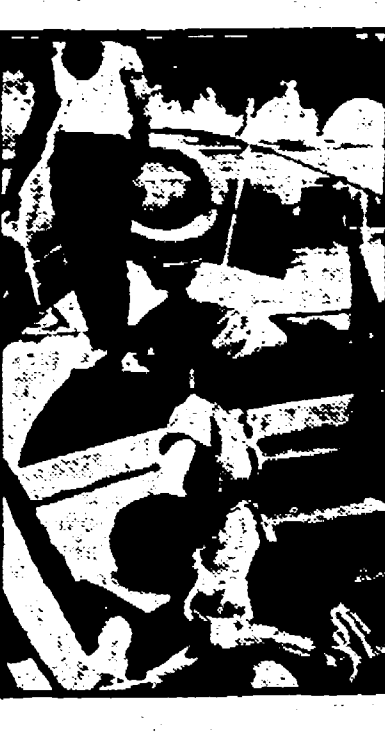
l'agosto quando l'afa diventa più attimata. Per questo sono stati attrezzati i parchi e sono state programmate le iniziative guidate nei musei, monumenti, località di interesse culturale e artistico.

Chi a giocare nei parchi delle ville romane, chi a studiare, chi fuori all'estero, magari in un campo di lavoro, adde impare le lingue.