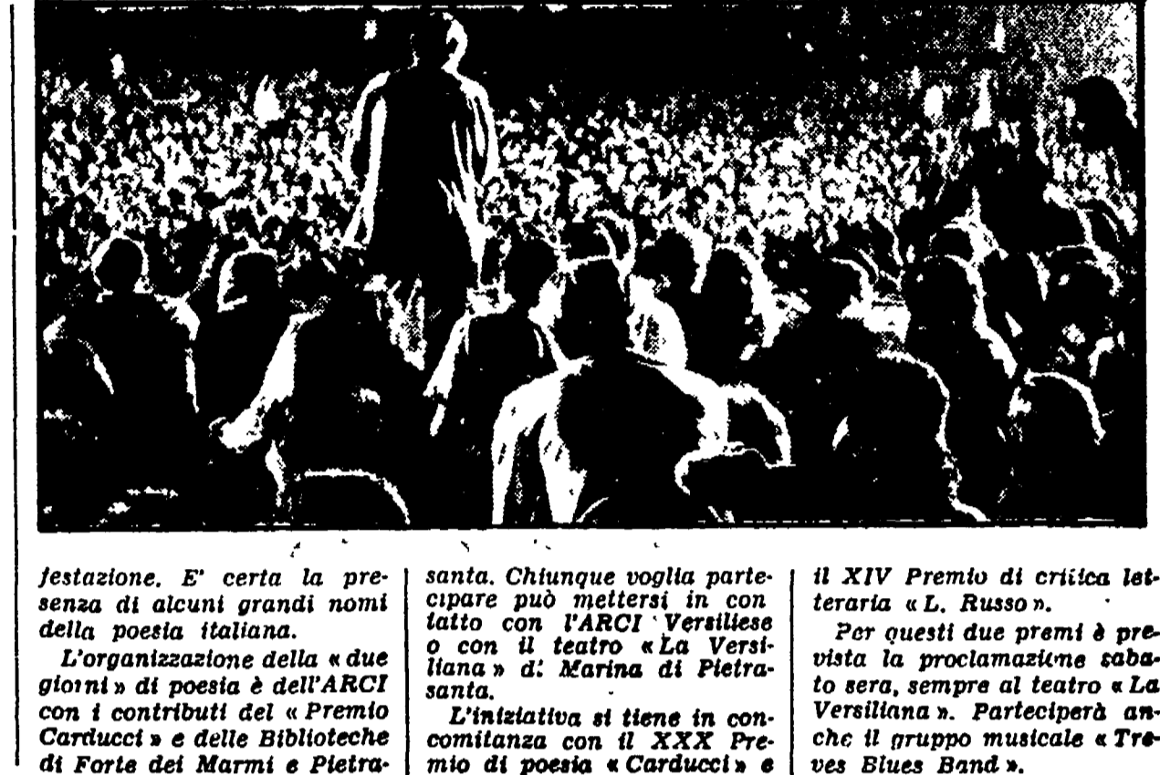
Il XIV Premio di critica letteraria «L. Russo». Per questi due premi è prevista la proclamazione sabato sera, sempre al teatro «La Versiliana». Parteciperà anche il gruppo musicale «Tres Blues Band».

VIAREGGIO — Che la poesia abbia ormai acquistato un posto di rilievo nella cultura italiana ce lo dimostrano le iniziative di Roma, Firenze e di altri grandi centri ma anche le manifestazioni che stanno crescendo un po' ovunque in tutta la penisola. Tra queste fa spicco il festival intitolato «Lo spettacolo della poesia, la poesia dello spettacolo» che si svolgerà nel parco della «Versilia» di Marina di Pietrasanta domenica e lunedì. L'originalità della manifestazione è nella partecipazione, accanto ai poeti, di musicisti, saltimbanchi, ballerini classici e d'avanspettacolo. Intanto — affermano gli organizzatori dell'ARCEI — è quello di un diverso approccio ai testi poetici, rendendo pubblico e spettacolare il momento di incontro con il testo poetico. Sarà inoltre possibile per chiunque voglia salire sul palco recitare i propri testi poetici. Da questi sarà a ritraccio l'antologia da pubblicare dopo la manifestazione.