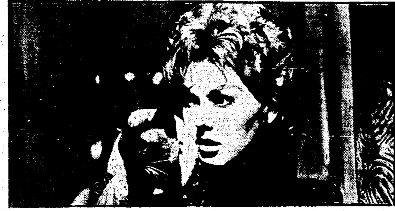
Kim Novak in «Una strega in paradiso»

Domenica 30 agosto: «Una strega in paradiso» regia di Richard Quine; interpreti: Kim Novak, James Stewart, Jack Lemmon (1958), 120 min., colore; ore 22,30. «Zuppa d'anatra» regia di Leo McCarey; interpreti: Groucho, Harpo, Chico e Zeppo Marx. Prod. 1933, 70 min.