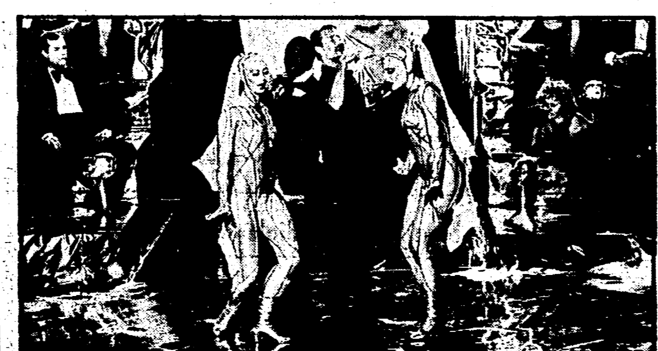
La scena finale del film «All that jazz»