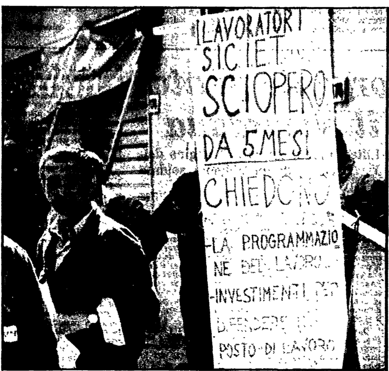
Una recente manifestazione degli operai della SICIET

Di fronte a questo atteggiamento, la Federazione unitaria ha dichiarato lo stato di agitazione con azioni di lotta che si intensificheranno nei prossimi giorni.