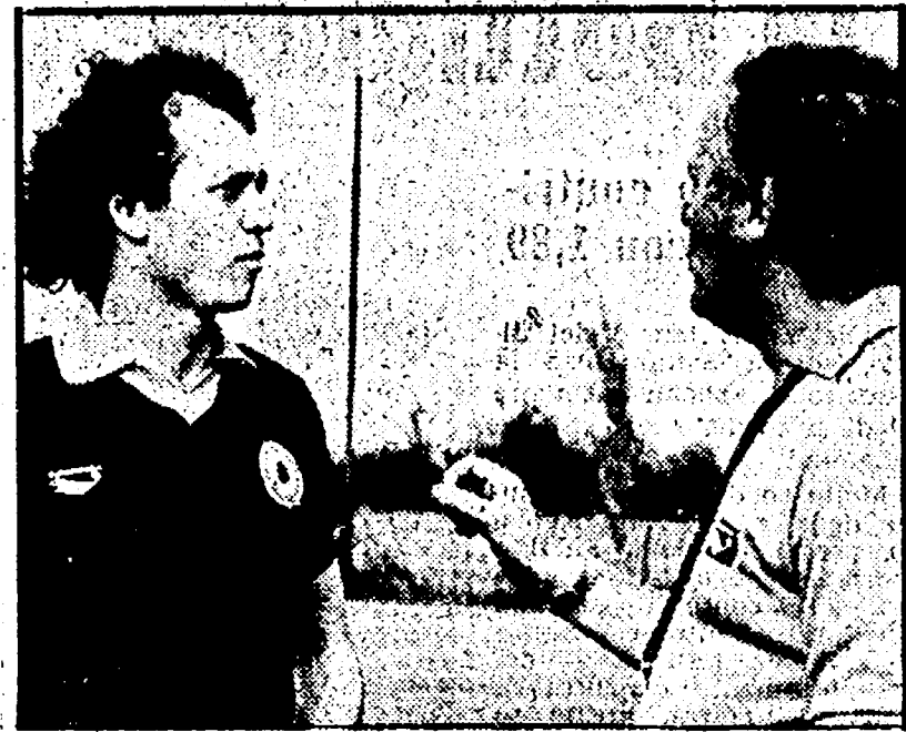
LIEDHOLM e FALCAO: suggerimenti del tecnico su come arrivare a traguardi ambiziosi?