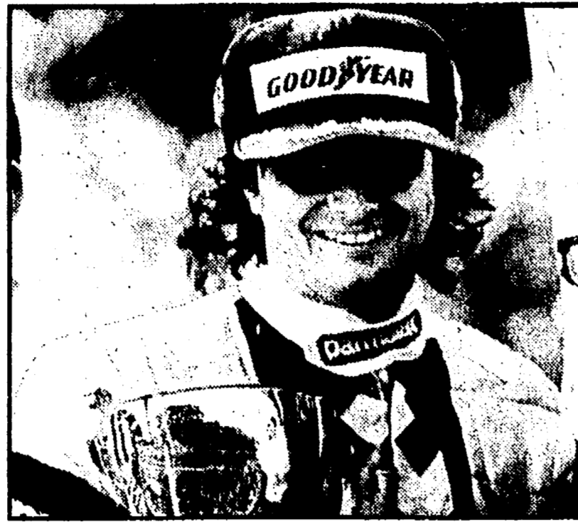
IMOLA - Il sorriso del vincitore, foto piccola, e un'emozionante fase dell'avvio.

Grande folla per il 1° G.P. d'Italia sul nuovo circuito. Resta in discussione la classifica mondiale.