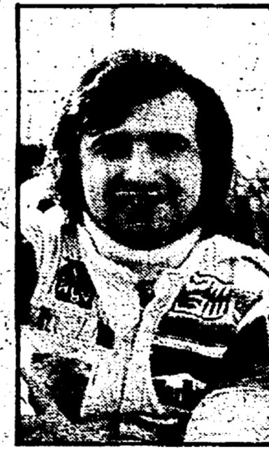
Bruno Giacomelli: un'altra gara sfortunata.