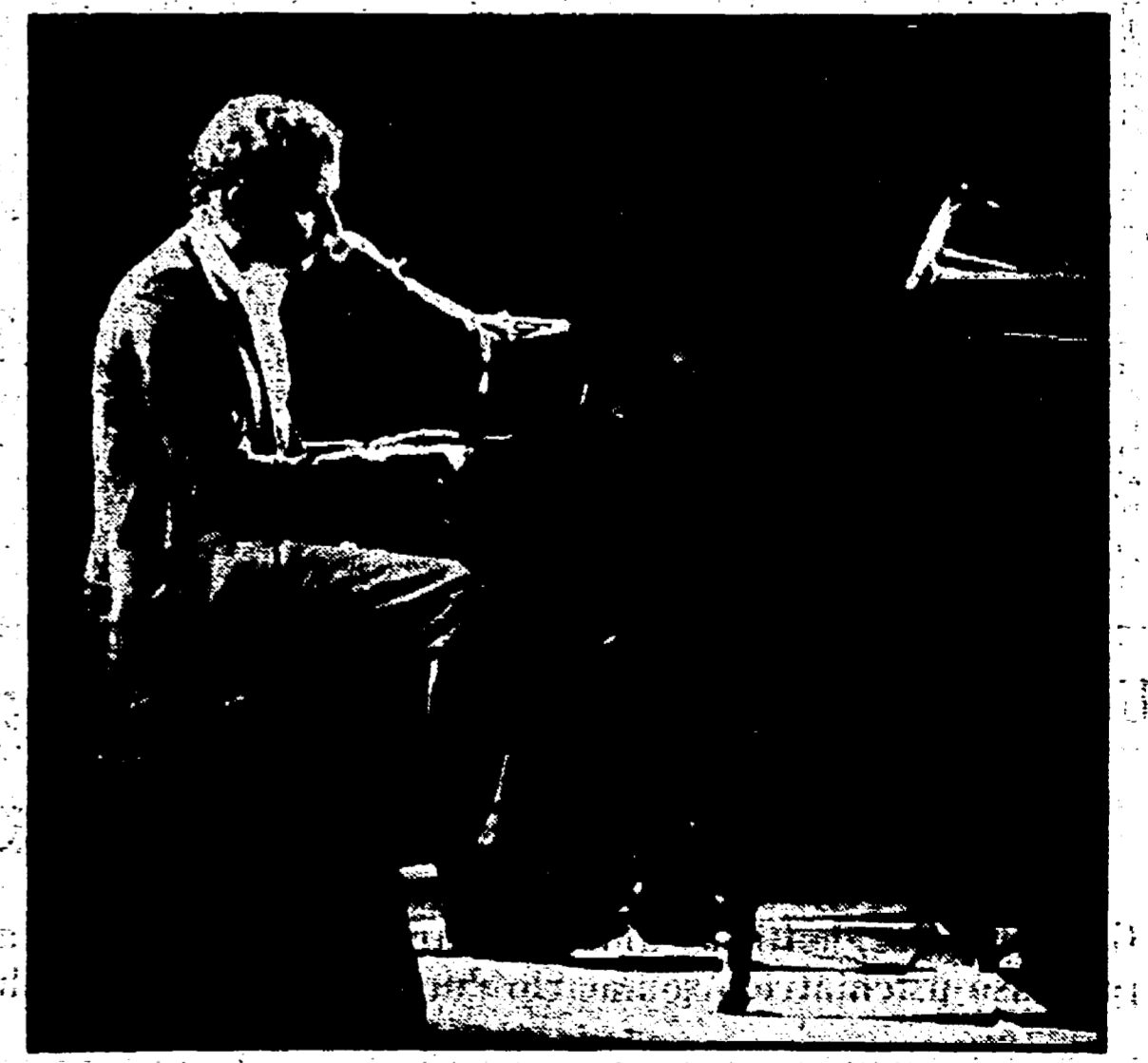
PAOLO CONTE AL «PINCIO»