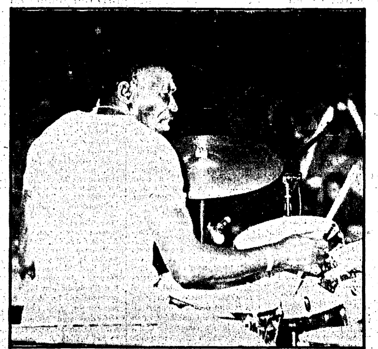
Il celeberrimo batterista Elvin Jones

Al « Labirinto », in via Pompeo Magno. Cinque appuntamenti riscattano un'estate «povera» di jazz