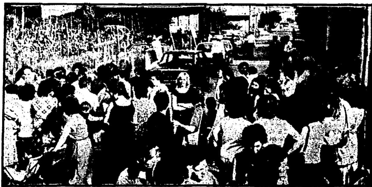
Manifestazione a Finocchio contro le case abusive, per la scuola

Sull'area sarà costruito un edificio per ospitare le sezioni di una media e una materna - L'impegno del Comune: presto avranno inizio i lavori, anche se qualcuno prova a sbancare il terreno