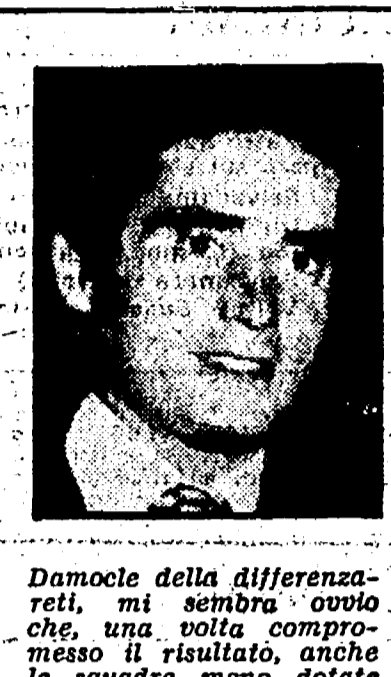
Damocle della differenzia reti, mi sembra ovvio che, una volta compreso il risultato, anche le squadre meno dotate di tecnica e tattica si stiano, con susseguente beneficio per lo spettatore.

Proprio niente male le premesse di questo campionato. Dopo le prime avvisaglie della giornata inaugurata da Inter, Fiorentina e Roma si conferma a sette giorni di distanza: 21 reti, una sola partita terminata sullo 0 a 0. Se si cerca una ragione idonea per riavvicinare il pubblico al calcio, ecco questa del gol: mi sembra la migliore e la più indicata. Indubbiamente è un campionato che promette scintille. Finalmente anche i più recalcitranti hanno scoperto il fascino del tiro da lontano, tutti sembrano aver riscoperto l'importanza che ha il tentare più spesso il tiro anche da lontano. È un campionato che promette scintille, ho detto, ma è anche un campionato che rischia di appesantirsi, quanto prima, in due tronconi. Da