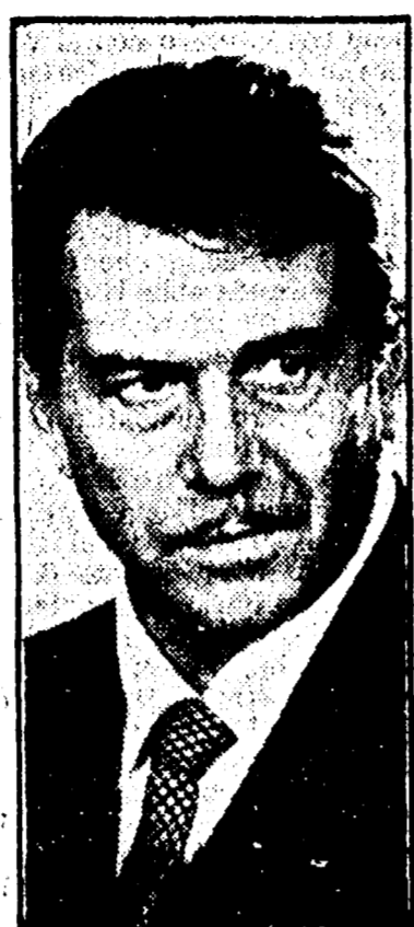
Enrico Maria Salerno