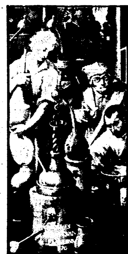
Particolare de «L'Alchimista» (G. Stradano). Studio di Francesco I dei Medici - Palazzo Vecchio

Firenze Palazzo di Parte Guelfa: «Umanesimo - Disumanesimo nell'arte europea 1890-1980». (Alla mostra afferiscono le 10 installazioni di artisti contemporanei in vari luoghi della città) (fino al 30 novembre).