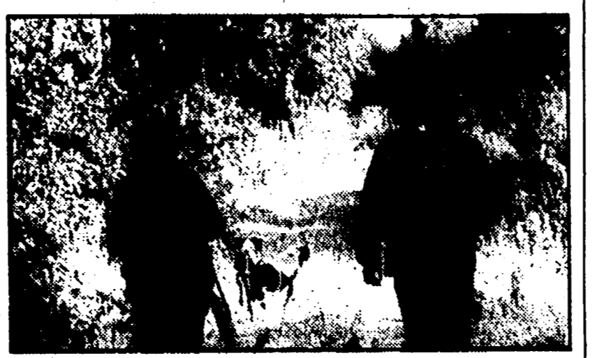
Non saranno state elaborate le carte faunistiche delle varie zone del territorio nazionale.

meno di quanto ci occorre, il nostro livello di autoapprovvigionamento arriva a malapena al 70%, in dodici mesi abbiamo dovuto importare qualcosa come 4 milioni di quintali di carne e suini vivi.