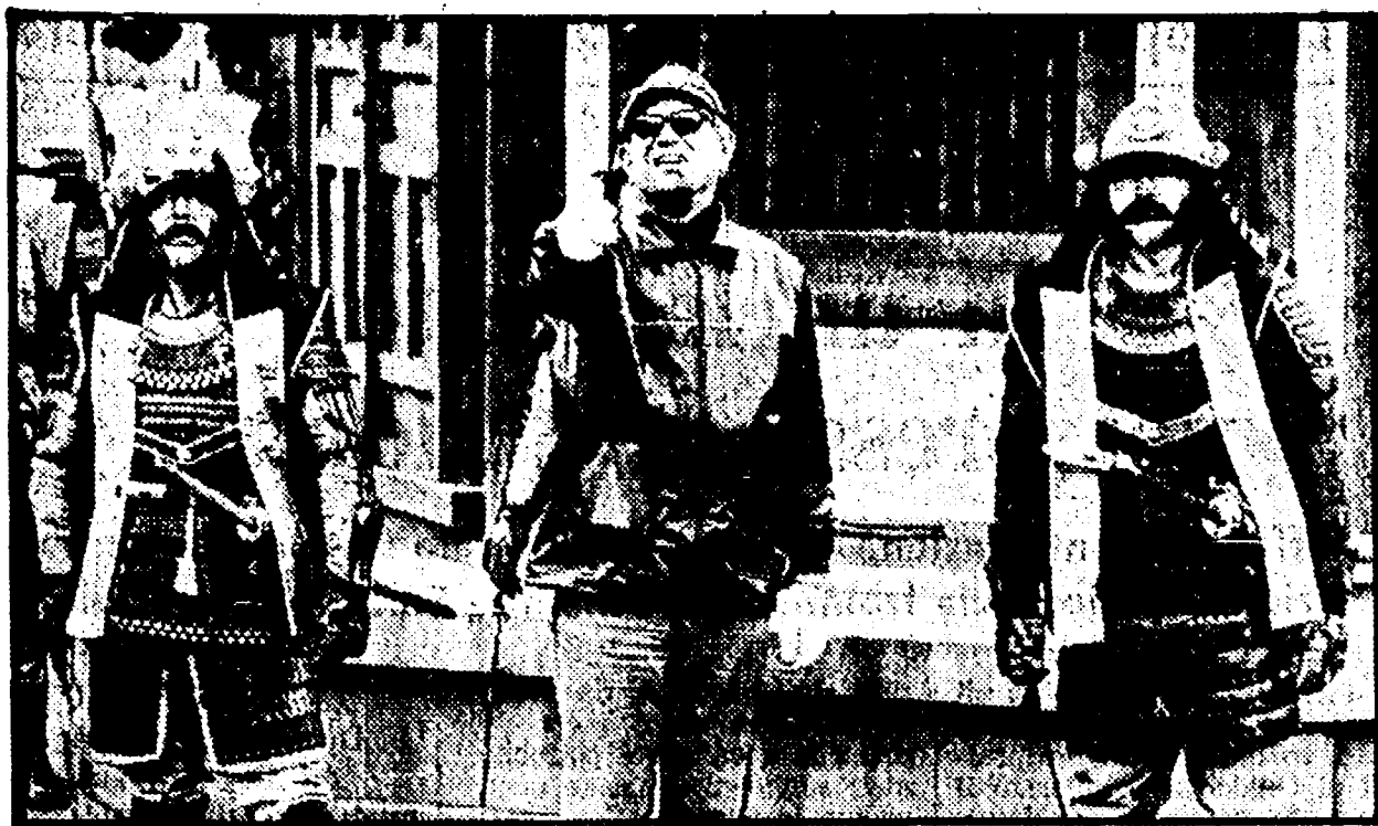
Il regista Akira Kurosawa durante la lavorazione del film «Kagemusha» accanto al titolo.