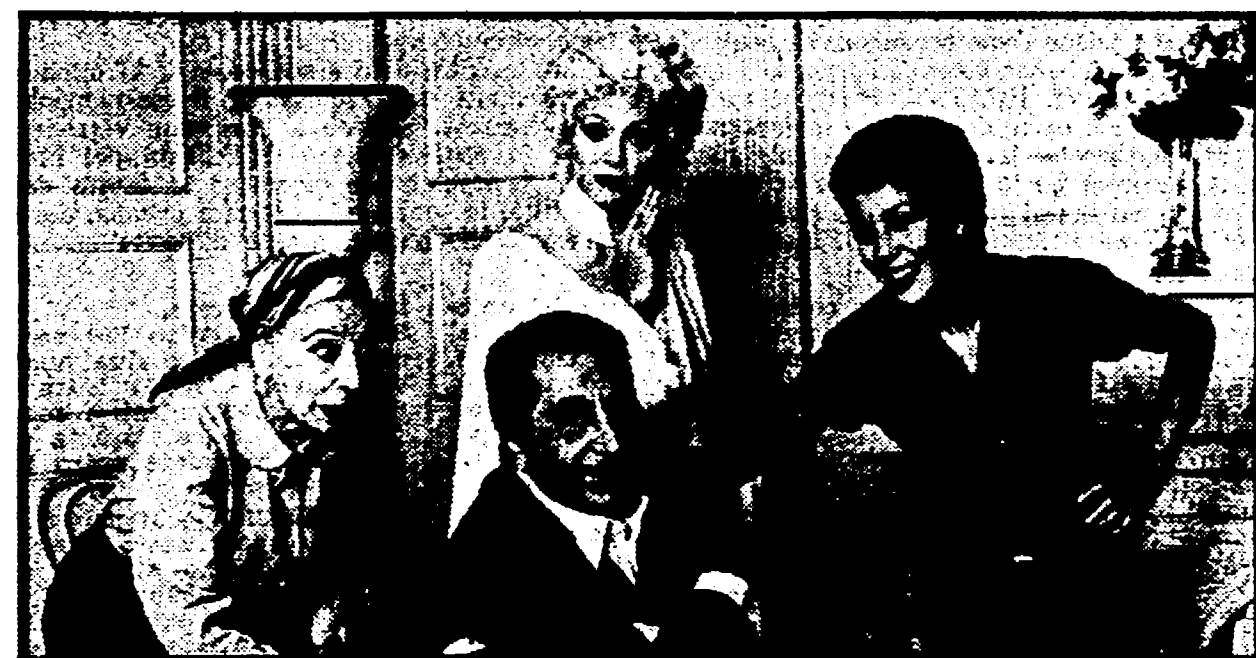
Una scena di « Spirito allegro » presentata al Teatro Delle Arti

Deludente riproposizione della commedia di Noel Coward diretta da Lorenzo Salvetti - Buoni attori