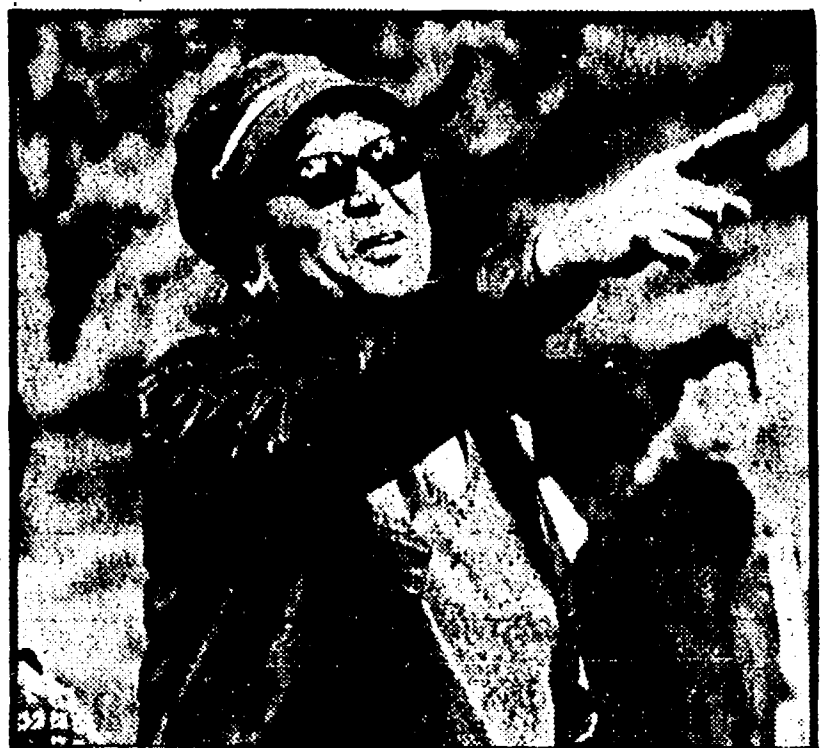
Tatsuya Nakadai, protagonista del film premiato a Cannes