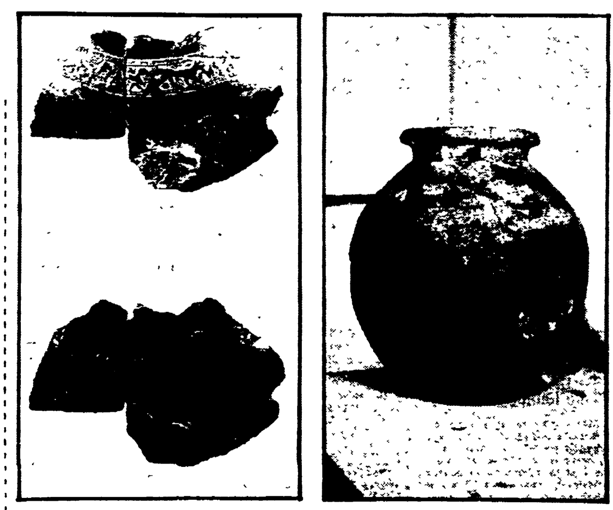
Frammento di bucchero (a sinistra) e olla ovoidale d'impiasto della prima metà del VI sec. A.C.

Gli studenti dell'Istituto di Archeologia di Perugia hanno rinvenuto dischi di terracotta a testimonianza che la famosa peltanza era in uso già nel Medioevo. Alla luce la vita quotidiana delle classi subalterne. Una serie di «scoperte a casaccio» - Oltre ai teschi con sopra croci cristiane anche ceramiche d'uso - Forse in primavera si arriverà al tempio di marmo bianco