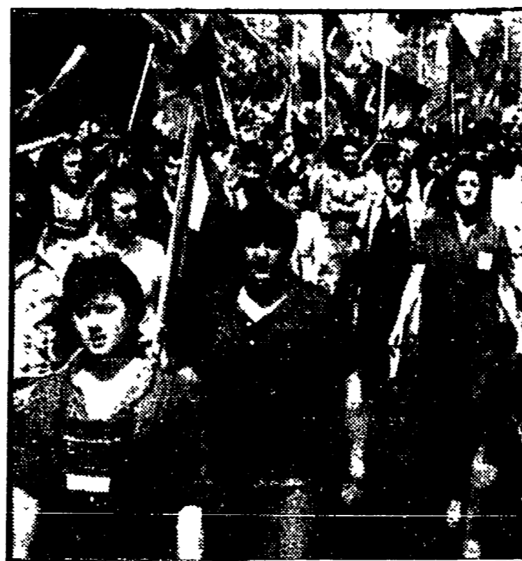
decisive per il futuro della zona - la mobilitazione, ieri, è stata assai ampia. Assieme ai lavoratori della Morteco-Soprefin hanno sfilato in corteo gli operai di tutte le fabbriche della zona (tra le altre la «Formenti», la «Cane» e la «Vistarini»)

CASERTA - Ieri mattina a Sessa Aurunca si è svolta la manifestazione organizzata dal sindacato in concomitanza con lo sciopero di zona indetto a sostegno della lotta dei lavoratori della «Morteco-Soprefin» e per lo sviluppo della Provincia.