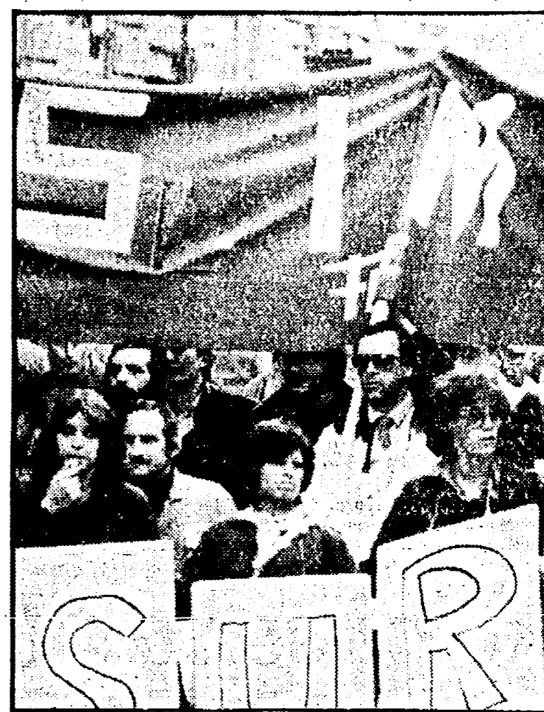
Una manifestazione di operai della SIME

Dopo giorni e giorni di pressione - Esaminata la situazione finanziaria e le prospettive di rilevamento dell'azienda