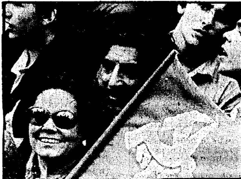
Madrid: una manifestazione del PCE

Realtà sociale del paese e prospettive di «alternanza» I rapporti tra comunisti e socialisti. Le Comisiones obreras, la UGT, e i governi locali: le difficili condizioni di un processo unitario