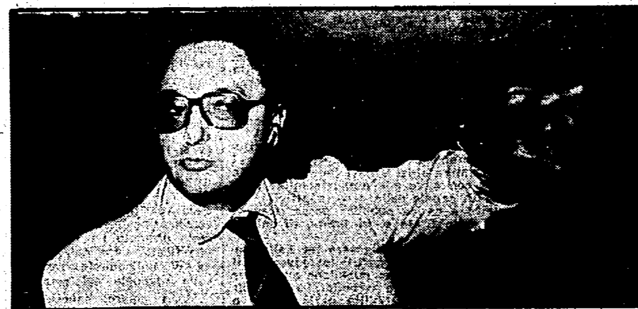
Gianni De Michelis