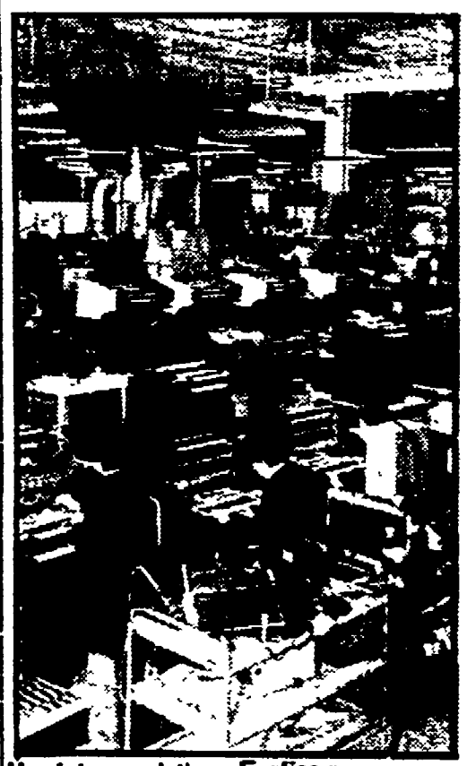
Un interno della «Farfisa»

I punti oscuri del costruendo Centro ricerca della fabbrica di strumenti musicali anconetana - La logica del ridimensionamento passa attraverso il preprezionamento di duecentoventi lavoratori