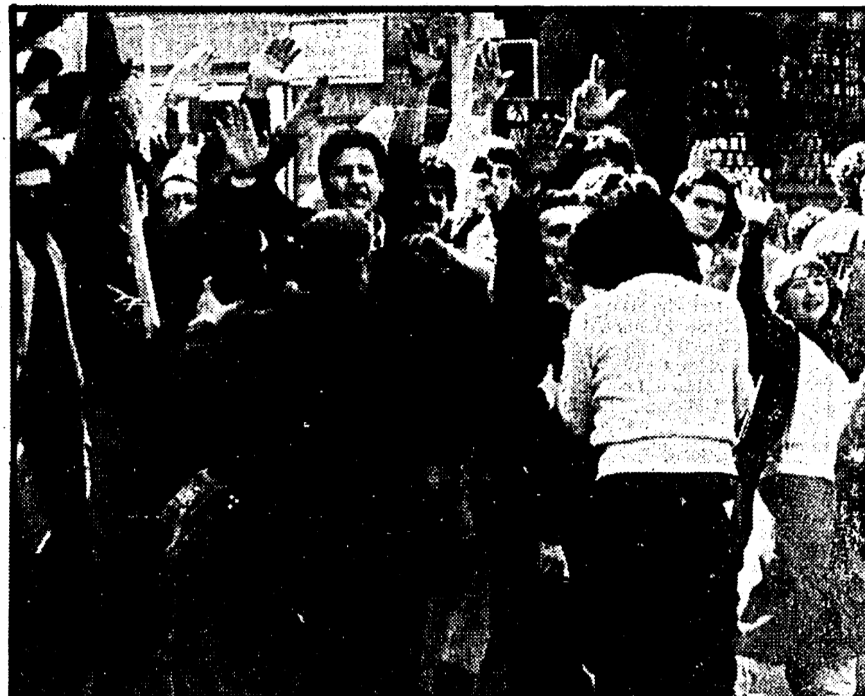
Napoli, il saluto fascista e il gesto della P38. A sinistra: la lapide per i morti di Bologna

Perché è nata un'area di fiancheggiatori dell'eversione dentro e fuori il MSI - Le teorie neonaziste e la difesa dei NAR «Negri e Piperno: simpatici rivoluzionari»