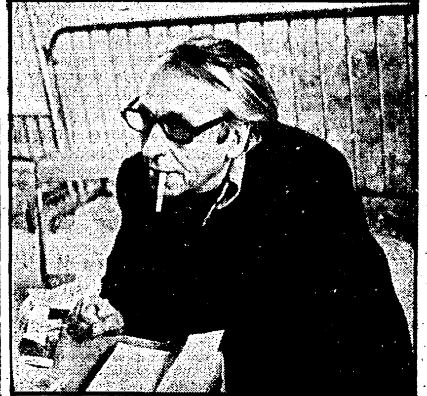
PARIGI — Il filosofo Louis Althusser