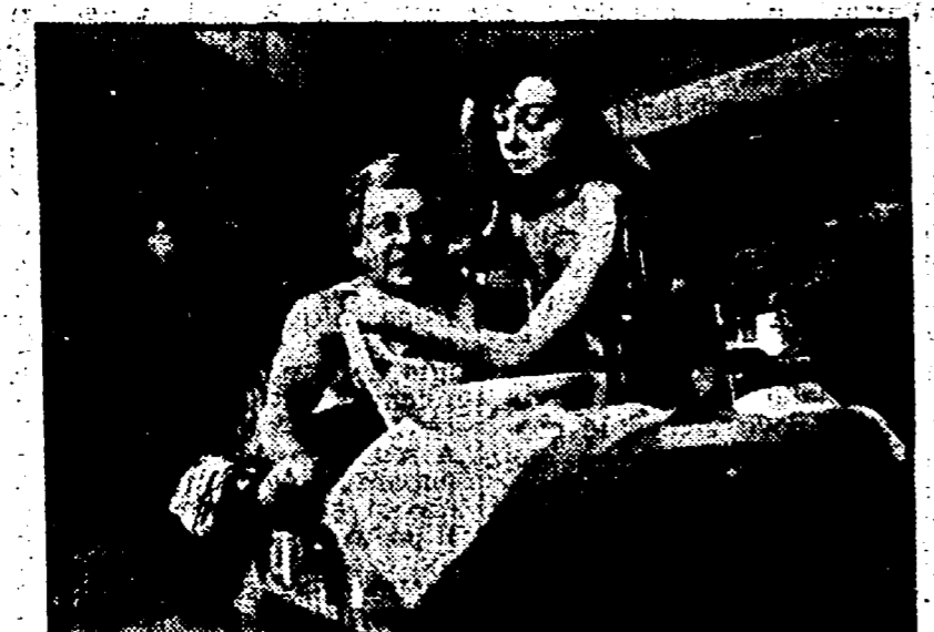
Paolo Villaggio e Milena Vukotic