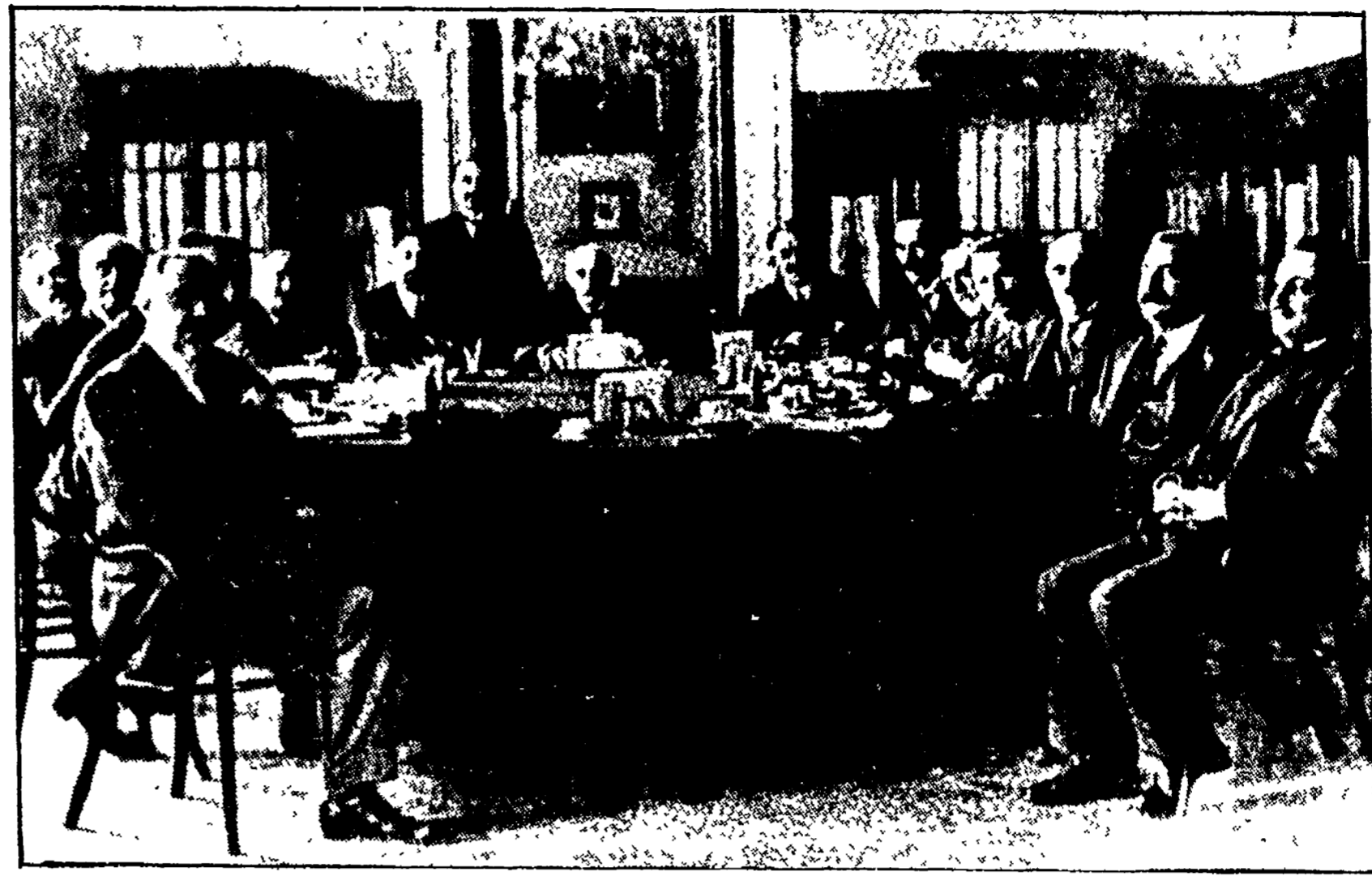
Analogie e differenze con lo scandalo che travolse Crispi