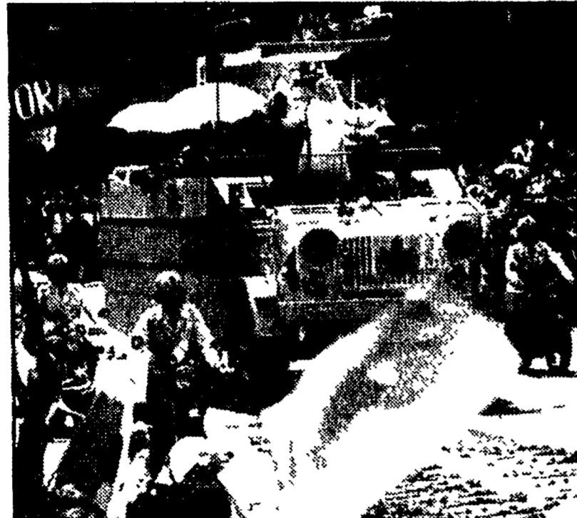
Giovanni Paolo II durante il suo viaggio in Polonia.