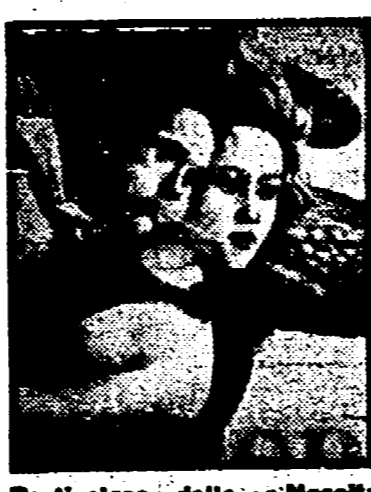
Particolare della « Nascita di Venere » di Botticelli

qualche modo partecipe dei due filoni culturali, non lo si può definire appartenente all'una o all'altra scuola. Uno studioso scrupoloso, con una posizione a se stante. Creativo, passionale. Guarda fisso all'opera d'arte. Le legge e ne fornisce una critica, insistendo dentro il metodo dello strutturalismo.