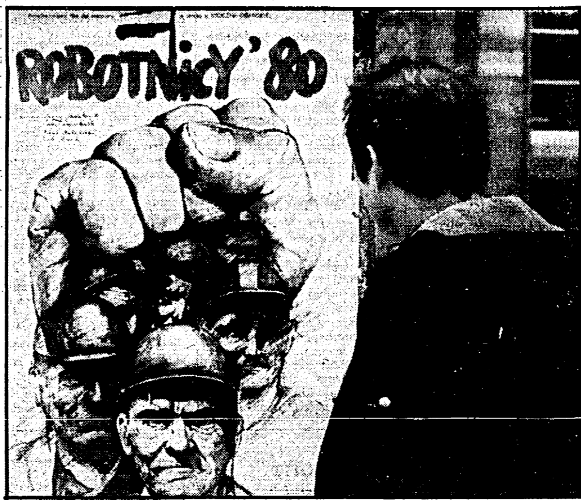
VARSAVIA — Manifesto del documentario « Operai '80 » sugli scioperi dello scorso agosto. Il film ha suscitato discussioni ed è ancora in attesa del visto di circolazione

Dopo tre giorni di scontri e disordini gli operai trovarono i cancelli delle fabbriche chiusi: reparti dell'esercito e della polizia fecero fuoco. La caduta di Gomulka. Come la stampa ricostruisce gli avvenimenti