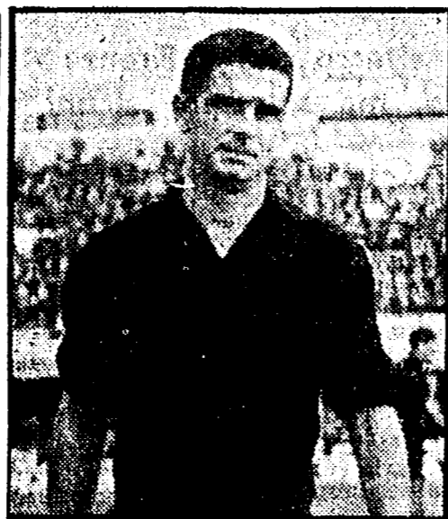
Balleri quando giocava nel Livorno

Nel 1966 ho praticamente iniziato la mia carriera di allenatore nei Montevarchi: scendevo però ancora in campo. Con il Montevarchi ci siamo sempre comportati bene: in tre campionati (a Montevarchi complessivamente ho trascorso undici anni della mia carriera calcistica) siamo arrivati una volta secondi e una volta abbiamo conquistato la promozione in serie C. Ho allenato anche il Livorno (serie B) e il Perugia (ancora serie B) ma quello fu un anno sfortunato; ho allenato anche a Massa e a Campobasso eppoi ancora a Montevarchi per diversi campionati. Da qualche mese sono alla guida del Siena. Una squadra che ho cercato di correggere nell'inquadramento. Da quando sono arrivato la mia squadra non ha mai perso, però abbiamo pagato alcuni incontri casalinghi mentre il Siena è una società che ha bisogno di vincere. D'altra parte da questo campionato di serie C-2 non c'è da attendersi molto: le prime vanno forte, troppo forte, noi viviamo alla giornata, domenica per domenica: alla fine del campionato tireremo le somme e vedremo quello che siamo riusciti a fare, se esiste una