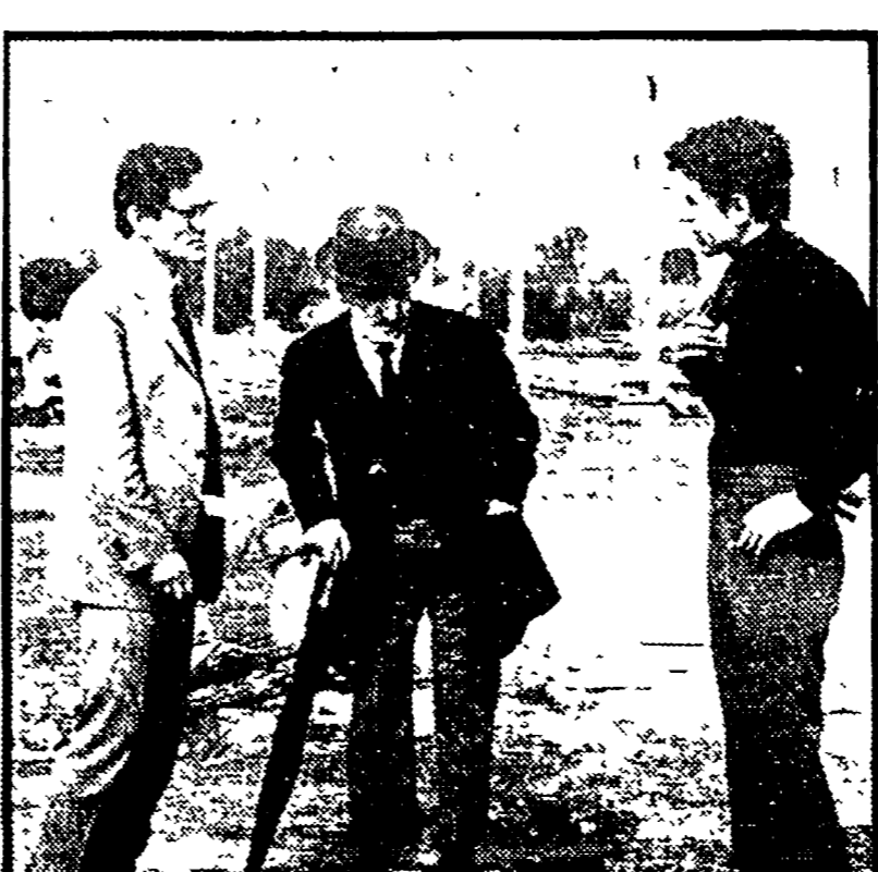
Totò con Pasolini e Ninetto Davoli