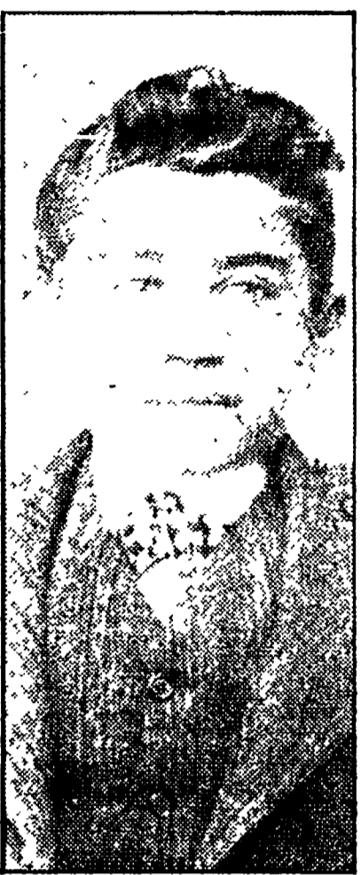
Antonio Gramsci ai tempi del liceo.