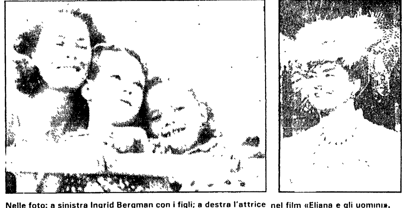
Nelle foto: a sinistra Ingrid Bergman con i figli; a destra l'attrice nel film «Eliana e gli uomini».

Incontro tra mito e realtà nella vita di una grande attrice come Ingrid Bergman - Un'avvincente autobiografia a quattro mani