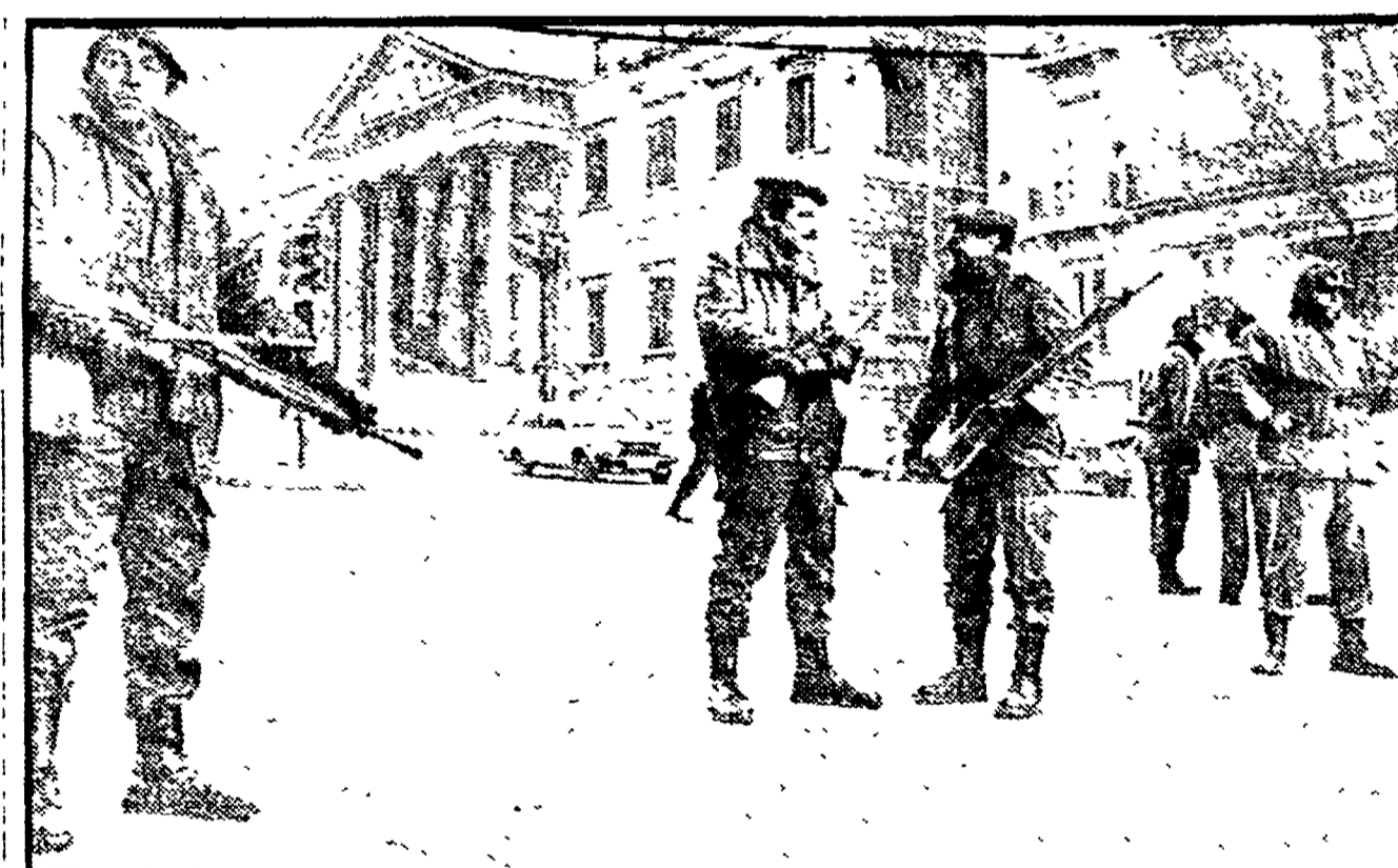
MADRID - Reparti armati vigilano sul Parlamento (sullo sfondo) dopo il fallito «golpe»