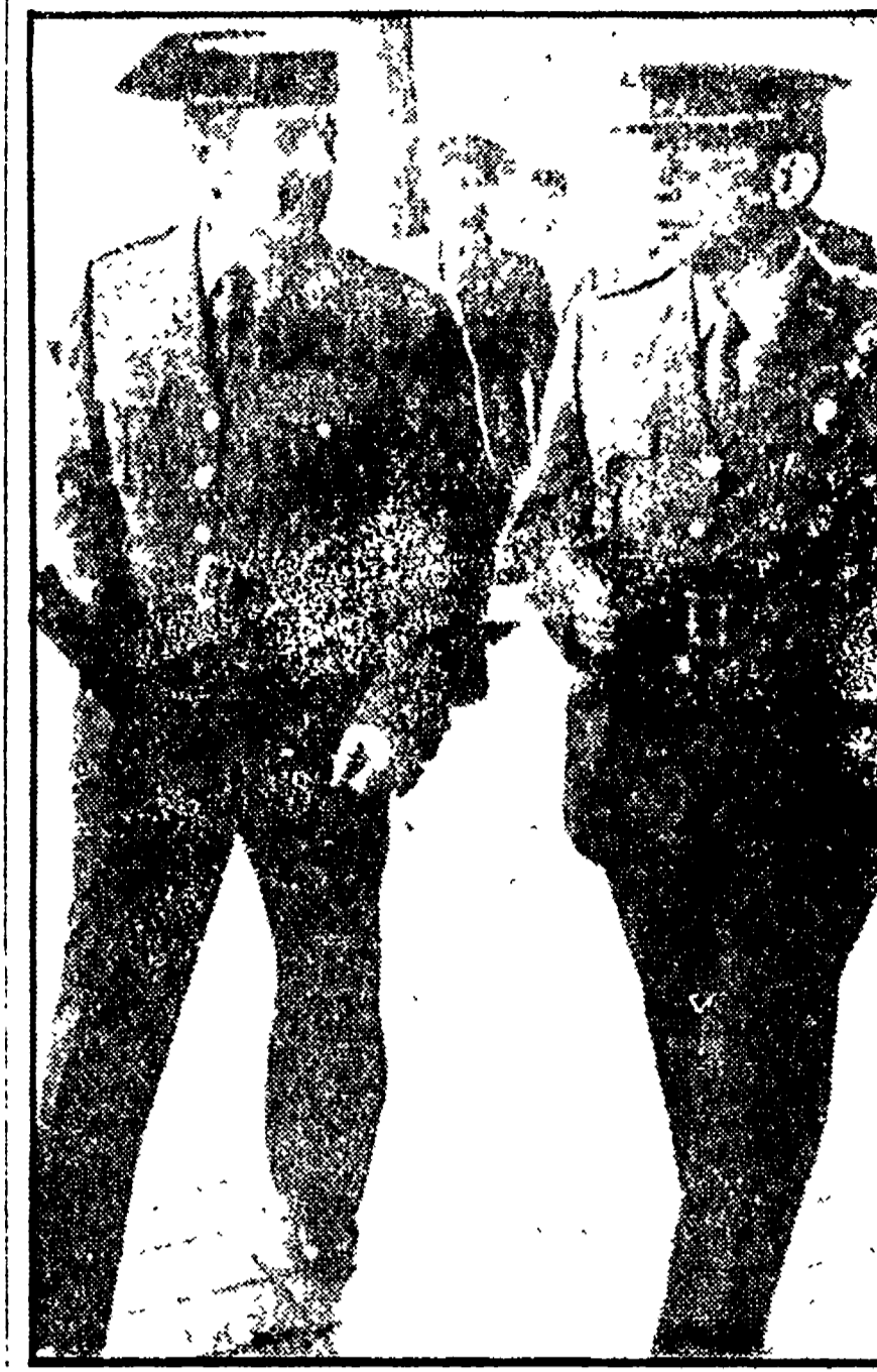
Il capitano de Inestrillas e il tenente colonnello Tejero all'epoca del processo dopo il fallito «golpe» del novembre 1978 di cui furono gli animatori