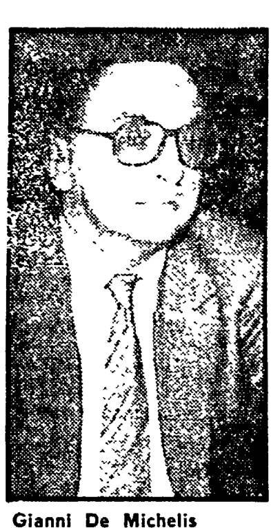
Gianni De Michelis