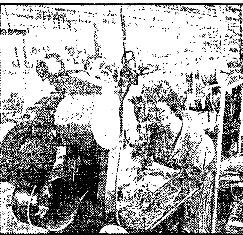
Il sindacato dal canto suo ha preso atto dei vari impegni del ministero dell'Industria...

Dal nostro corrispondente SIRACUSA - Ecco, in prima fila, le mogli dei lavoratori Montedison con i «loro» cartelli.