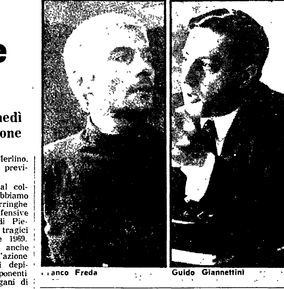
Inizierà il 4 maggio

«Un'ultima domanda. Uno dei nodi di questa sentenza è razziosamente dalla richiesta di condanna del procuratore generale nei confronti