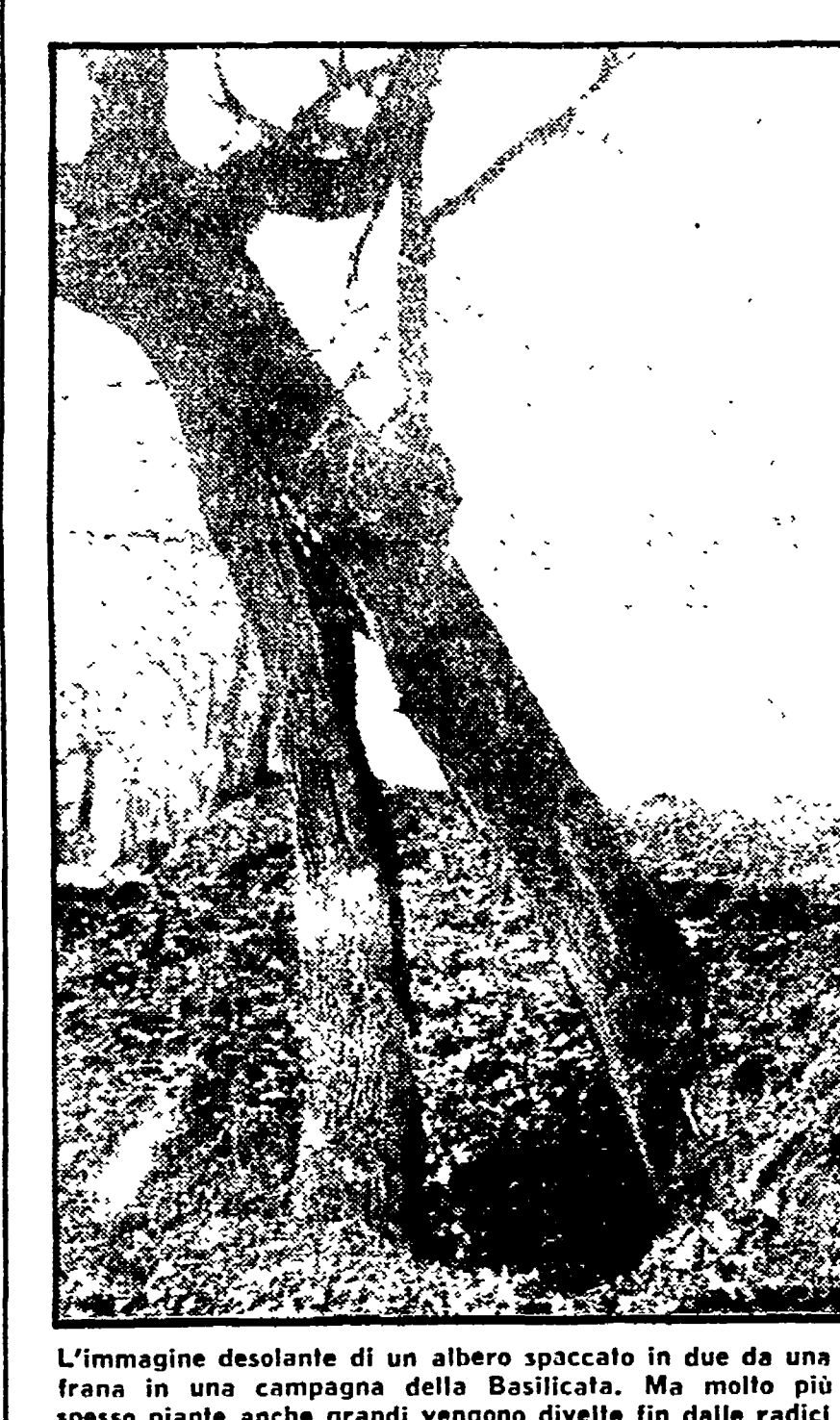
L'immagine desolante di un albero spaccato in due da una frana in una campagna della Basilicata. Ma molto più spesso piante anche grandi vengono divelte fin dalle radici