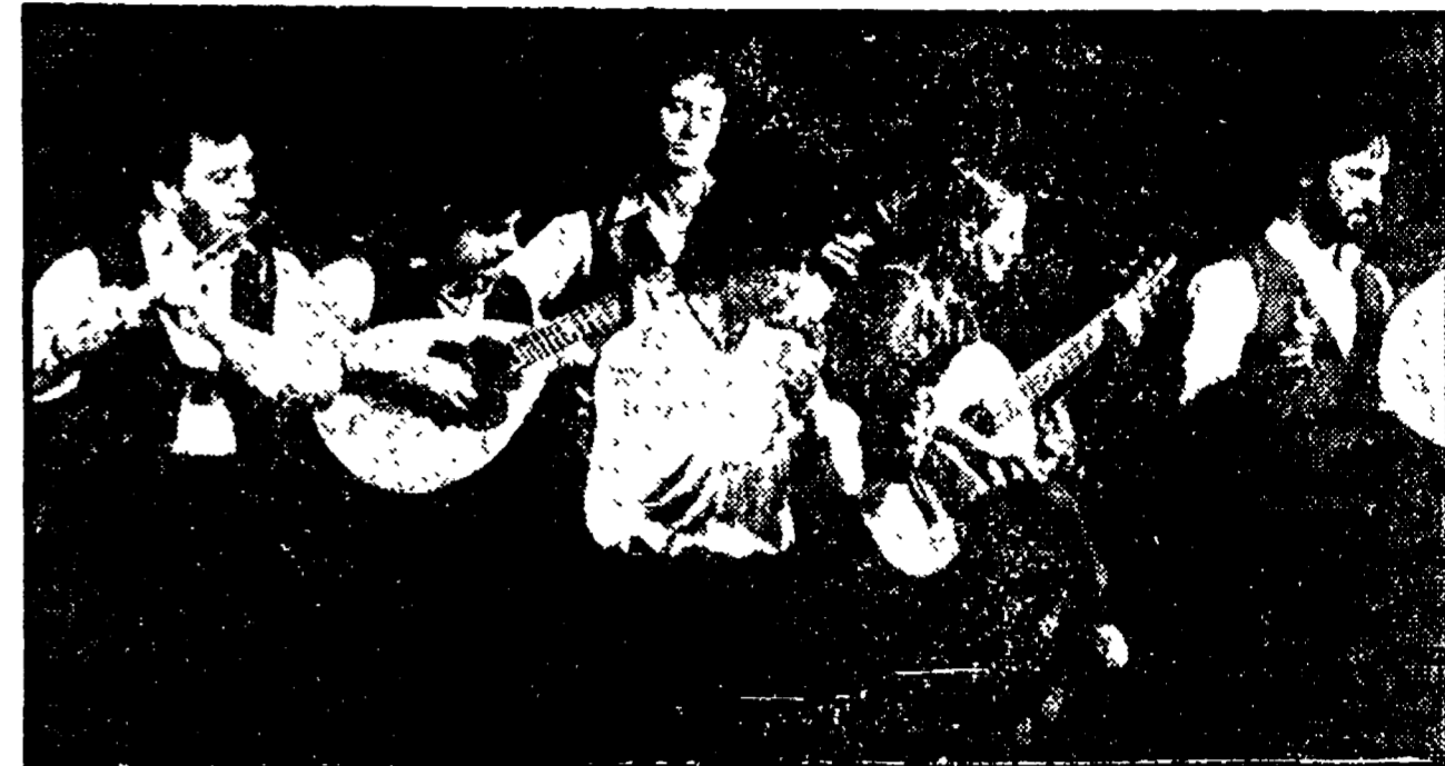
La Nuova Compagnia di Canto Popolare torna sulle scene con l'album «Storie di Fantanasia»

ROMA - Torna la Nuova Compagnia di Canto popolare: già, si dice sempre così quando un gruppo musicale rispunta fuori con qualcosa di inedito.