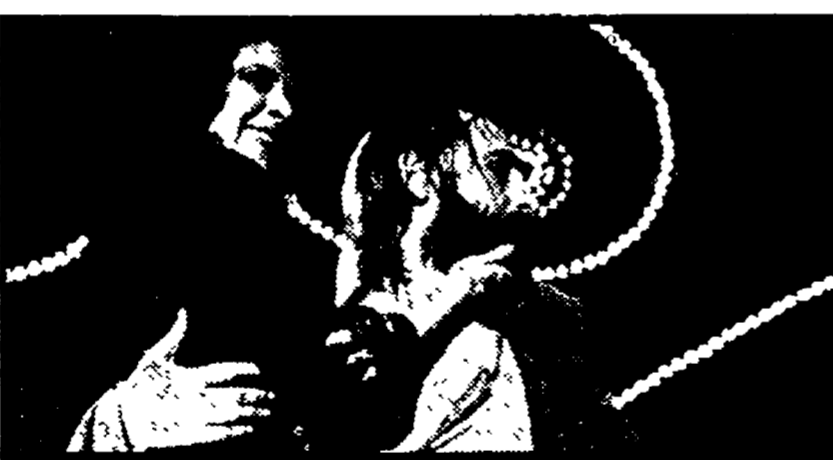
UNA FOTO: una scena di «Storie di ordinaria follia» tratto da Bukowski e allestito dalla Coop. «Granserraglio»

d'inserirsi nelle pieghe dell'industria culturale; dove si coglie, forse, un ammiccante richiamo autocritico dello stesso Bukowski.