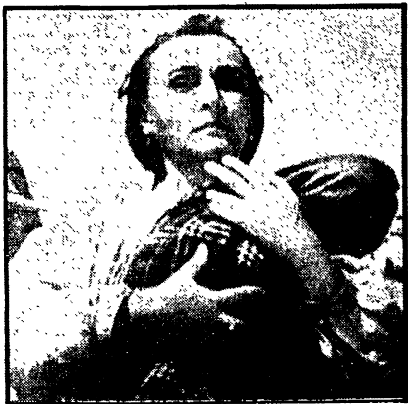
Qui sopra, un'inquadratura di "Arcobaleno"; in alto, a destra, il regista scomparso Mark Donskoj

per quanto tutt'altro che lineare, fu comunque assai diverso da quello del suo eroe cinematografico più noto. Già, perché Donskoj è passato alla storia del cinema quale autore, tra il 1938 e il '40, della trilogia ispirata ai ricordi autobiografici di Gorkij: "L'infanzia di Gorkij", "Tra la gente", "Le mie università".