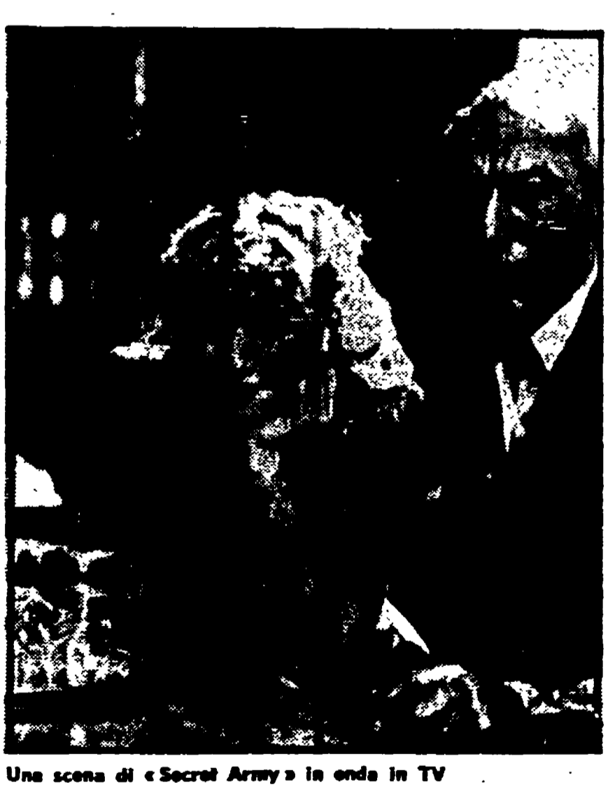
Una scena di « Secret Army » in onda in TV

Ancora una serie televisiva di marca BBC. Non c'è che dire, gli inglesi ne formano a ripetizione, e non tutte sono malvagie. Anzi. Quella che comincia stasera (Secret Army, Rete tre, ore 20,40) sembra avere tutte le carte in regola per strappare qualche telespettatore al classico varietà del sabato (che però oggi s'alta perché è Pasqua).