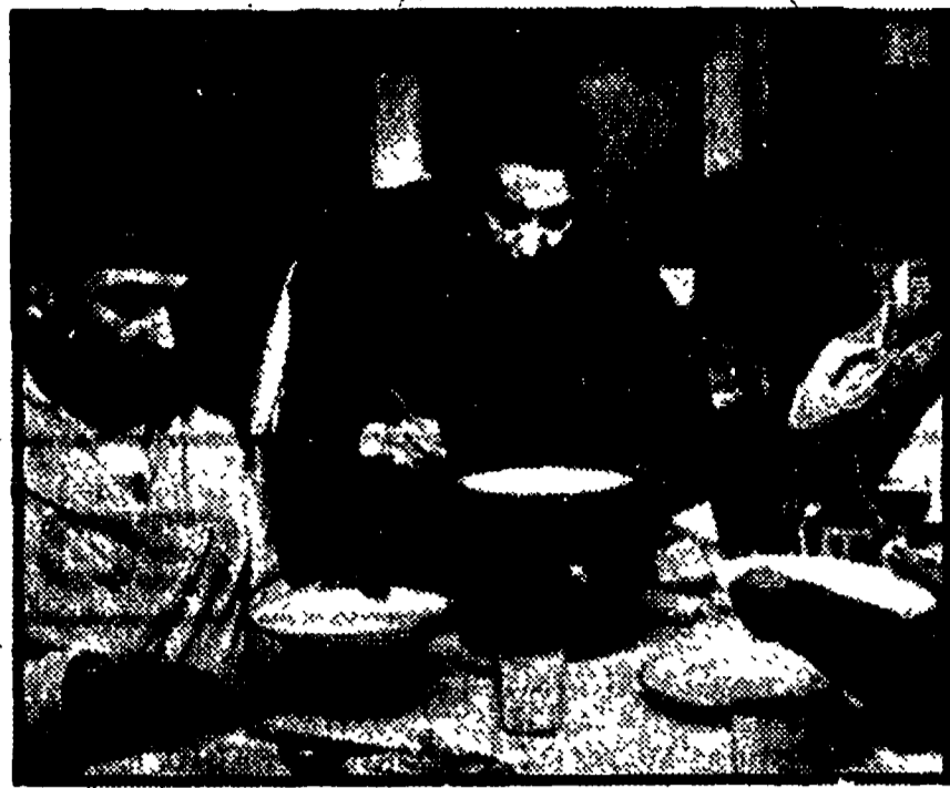
Aldrich, Tognazzi, Spencer Tracy, Buñuel, John Garfield, Fellini - Una valanga di pellicole sta per invadere le tre reti nazionali in concorrenza...

Il ciclo del film di Robert Aldrich comprende: « Vera Cruz », « Un bacio e una pistola », « Il grande coltello », « Prima linea », « Le colline dell'odio », « L'occhio caldo del cielo », « Che fine ha fatto Baby Jane? », « I quattro del Texas », « Piano piano dolce Carlotta », « Quando muore una stella », « Nessuna pietà », « Ma che la vede in un'isola », « Shiley Temple i titoli sicuri sono: « Riccioli d'oro », « Capitano Gennalo », « Cin cin », « La piccola principessa », « La piccola ribelle », « Una povera bimba milionaria », « Zoccolotti olandesi ».