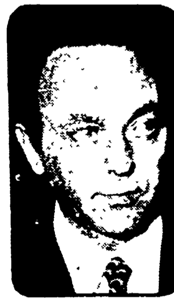
ATTILIO RUFFINI «Ministro vescovile»