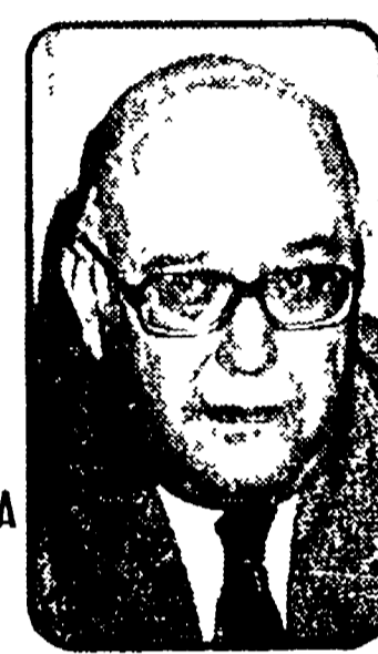
CESARE TERRANOVA il «Giudice»