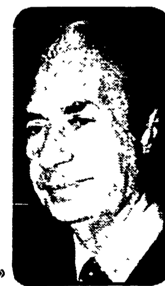
ALDO MORO il «Levanino»