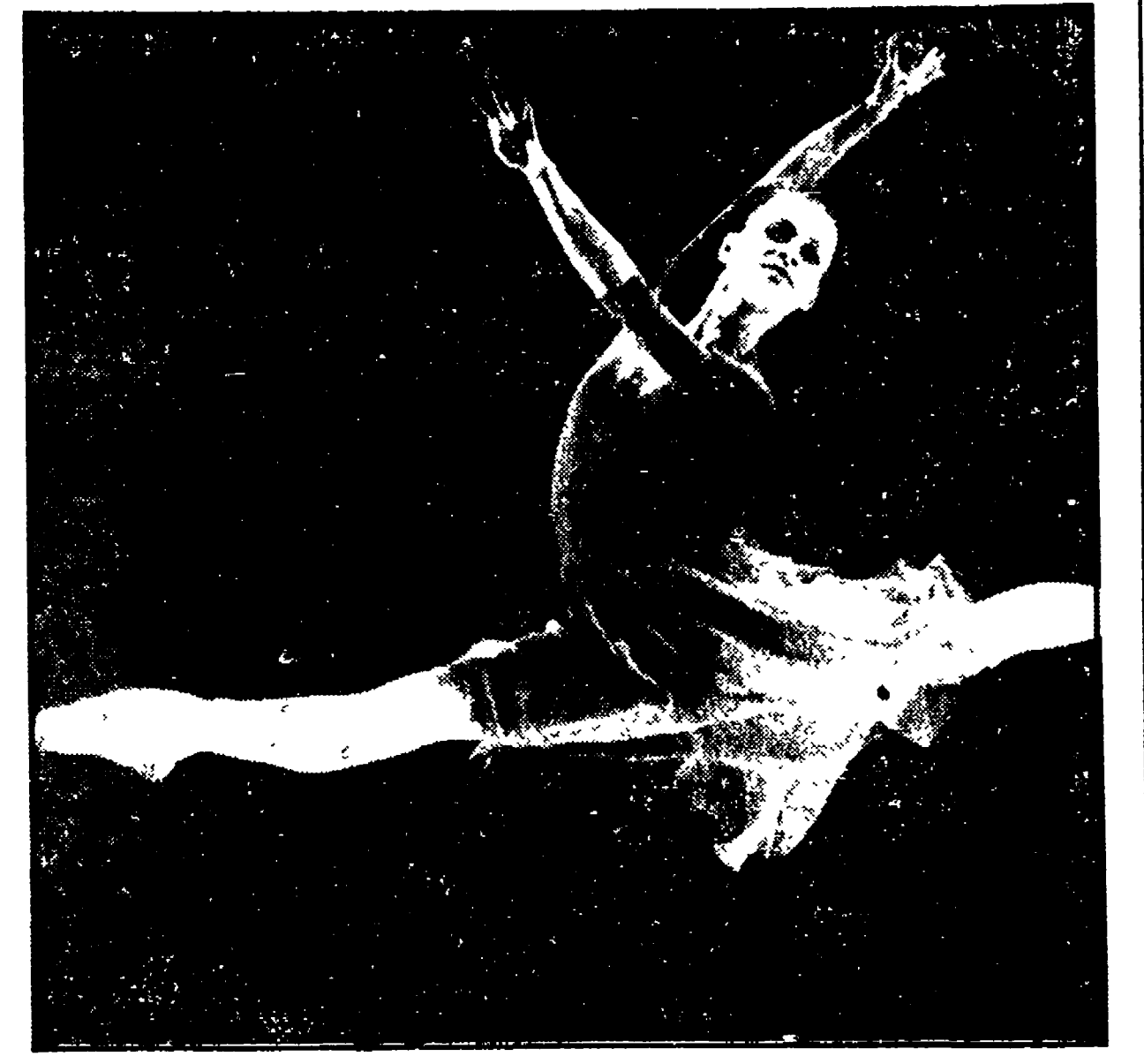
Birgit Cullberg, che danzerà da stasera al teatro Olimpico